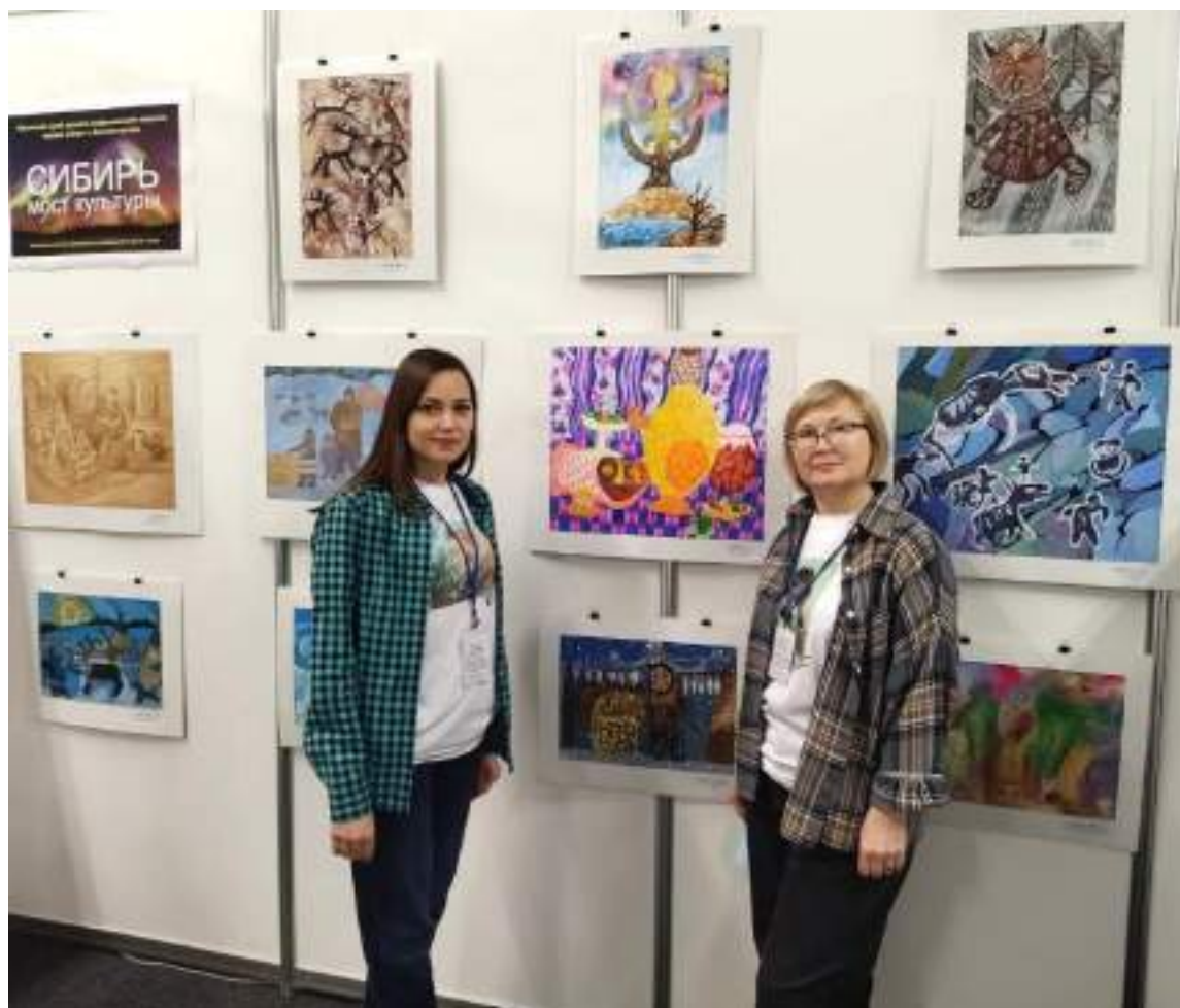
г. Новокузнецк, Международный конгресс коллекционеров, стенд ЮМДИИ, октябрь