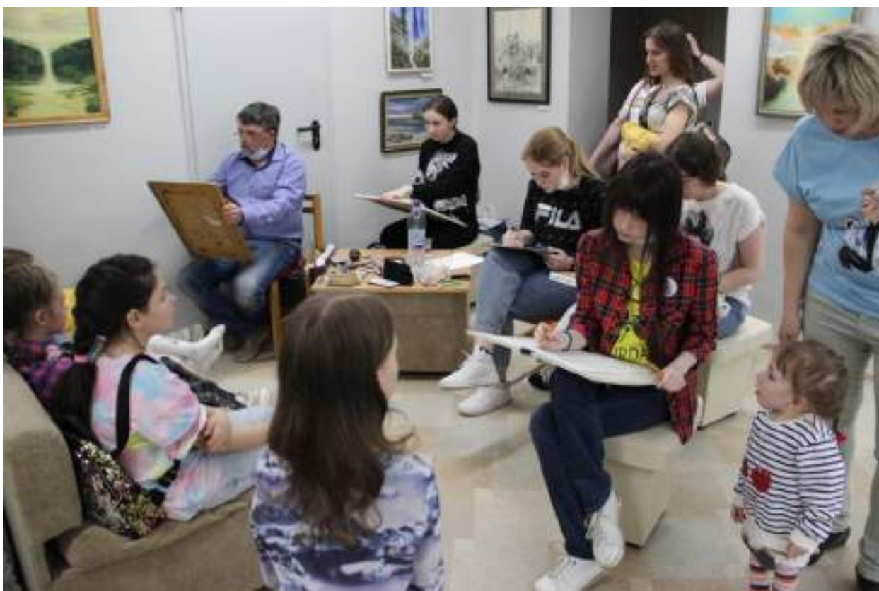
ЮМДИИ, Ночь музеев, 14 мая