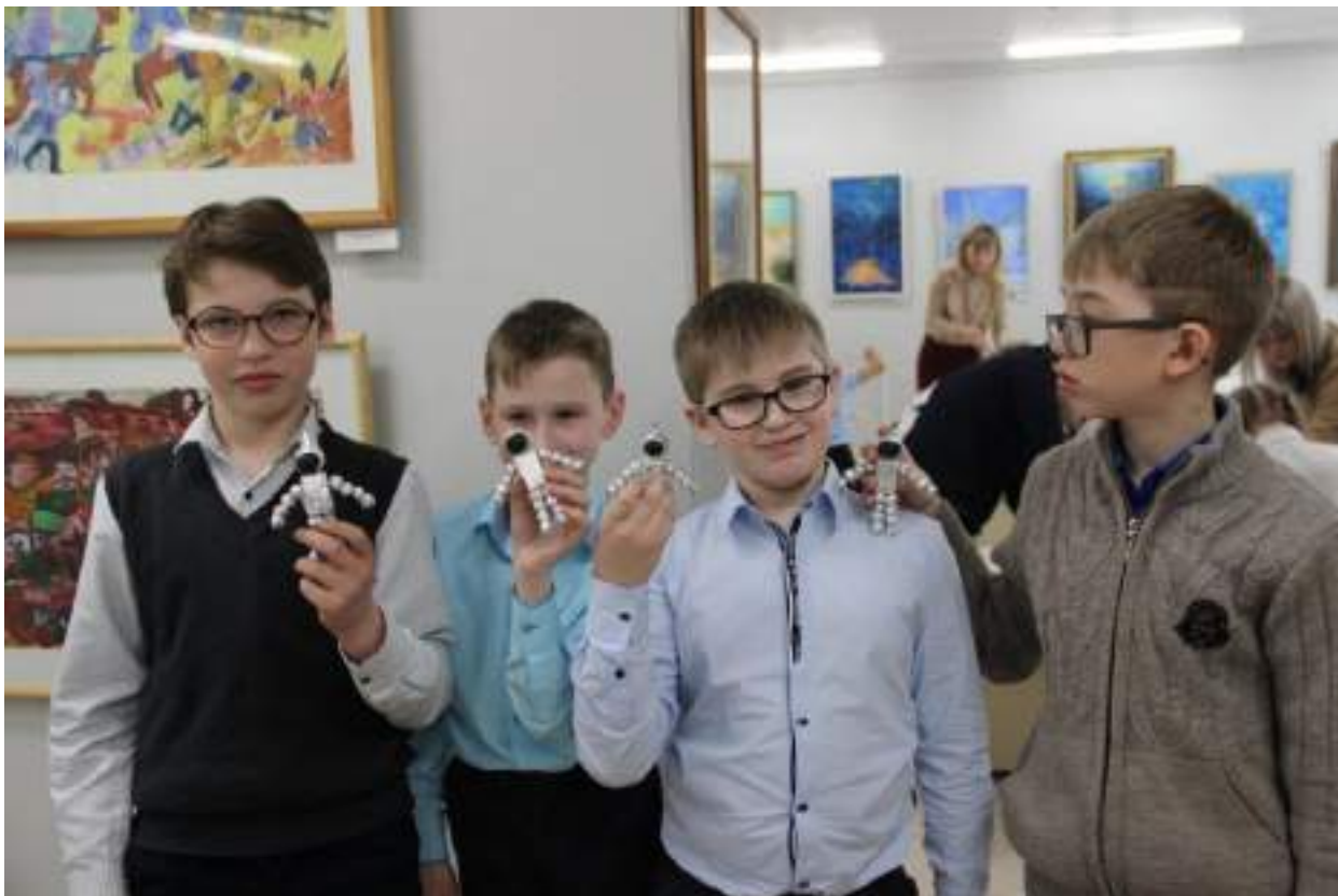
ЮМДИИ, культурно-развлекательная программа «Путь к звездам», март