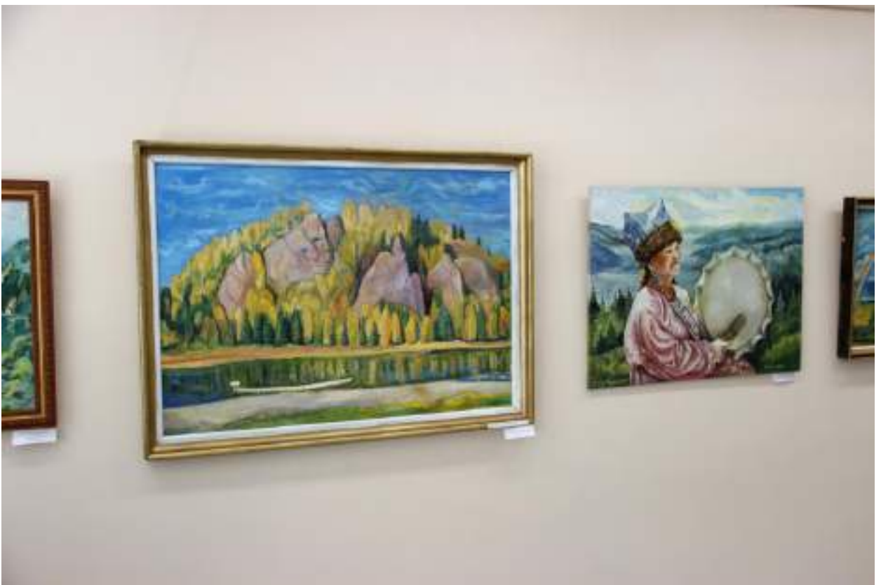
ЮМДИИ, выставка «Здесь отчий дом», июль