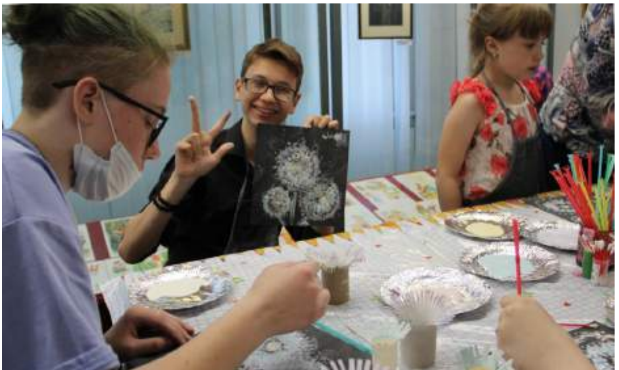
ЮМДИИ, Ночь музеев, 14 мая