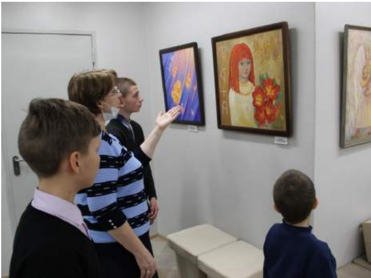
ЮМДИИ, экскурсия по выставке «Мой свет звездам», декабрь