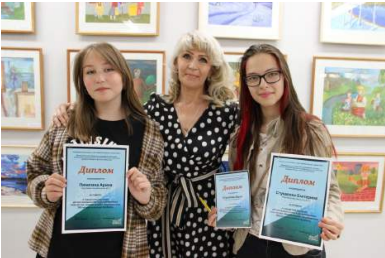
ЮМДИИ, открытие городской выставки детско-юношеского художественного творчества «Земля отцов», 2 июня