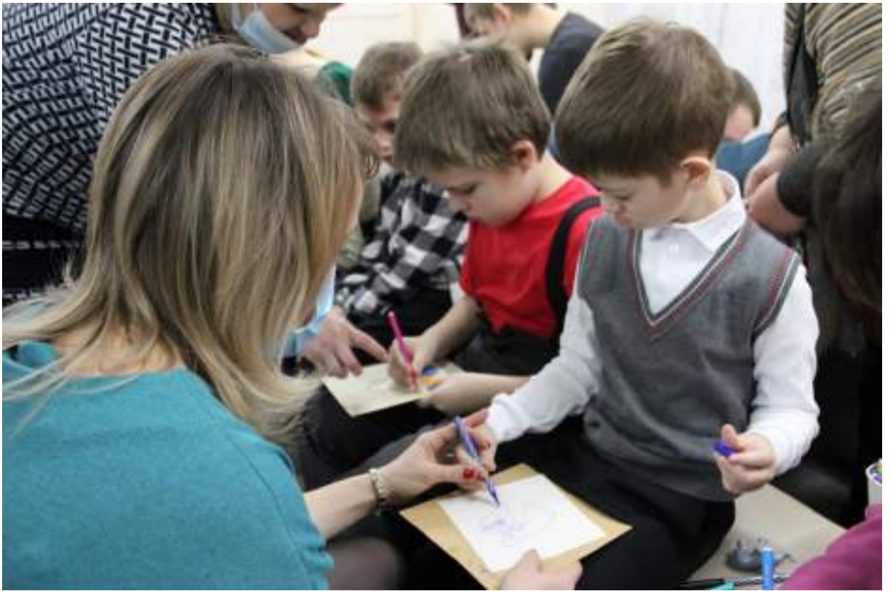
ЮМДИИ, дети-инвалиды в музее, занятие «Мир добра, любви и сказок», ноябрь