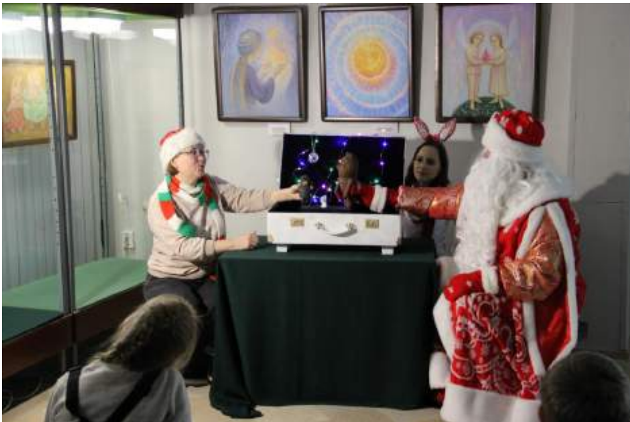
ЮМДИИ, праздничная программа «Волшебный чемоданчик», декабрь