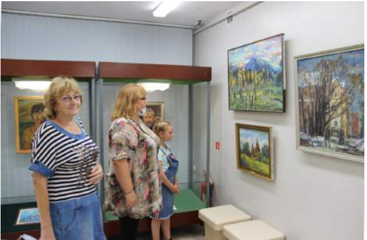
ЮМДИИ, выставка «Здесь отчий дом», июль