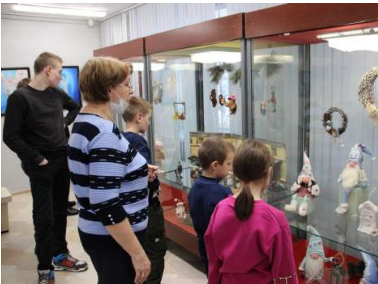
ЮМДИИ, экскурсия по выставке «Наши мастера», декабрь