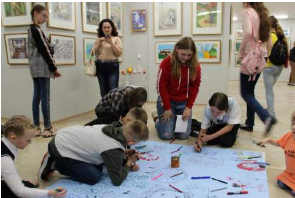
ЮМДИИ, открытие городской выставки детско-юношеского художественного творчества «Земля отцов», 2 июня