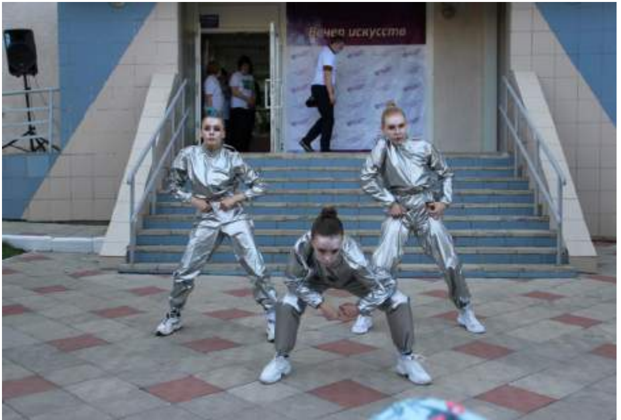
ЮМДИИ, Ночь музеев, 14 мая