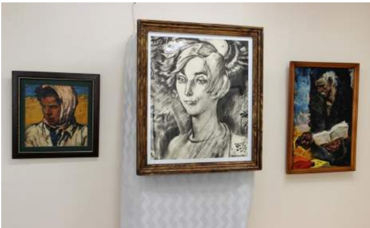
ЮМДИИ, выставка Г. Захарова «Пою мое Отечество», февраль