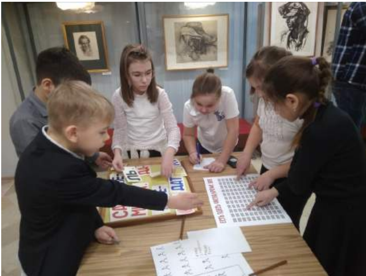
ЮМДИИ, культурно-развлекательная программа «Мы защитниками станем», февраль