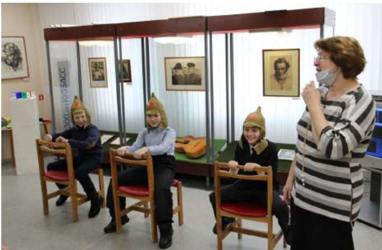
ЮМДИИ, культурно-развлекательная программа «Мы защитниками станем», февраль