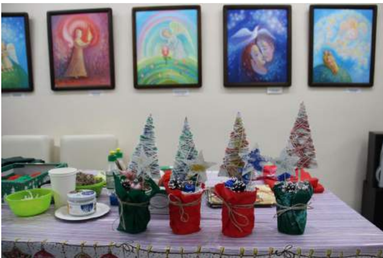
ЮМДИИ, праздничная программа «Волшебный чемоданчик», декабрь