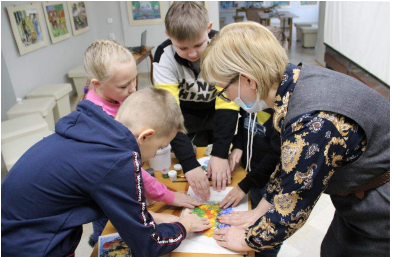
ЮМДИИ, всероссийская акция Ночь искусств, мастер-класс по монотипии «Осеннее отражение», 4 ноября