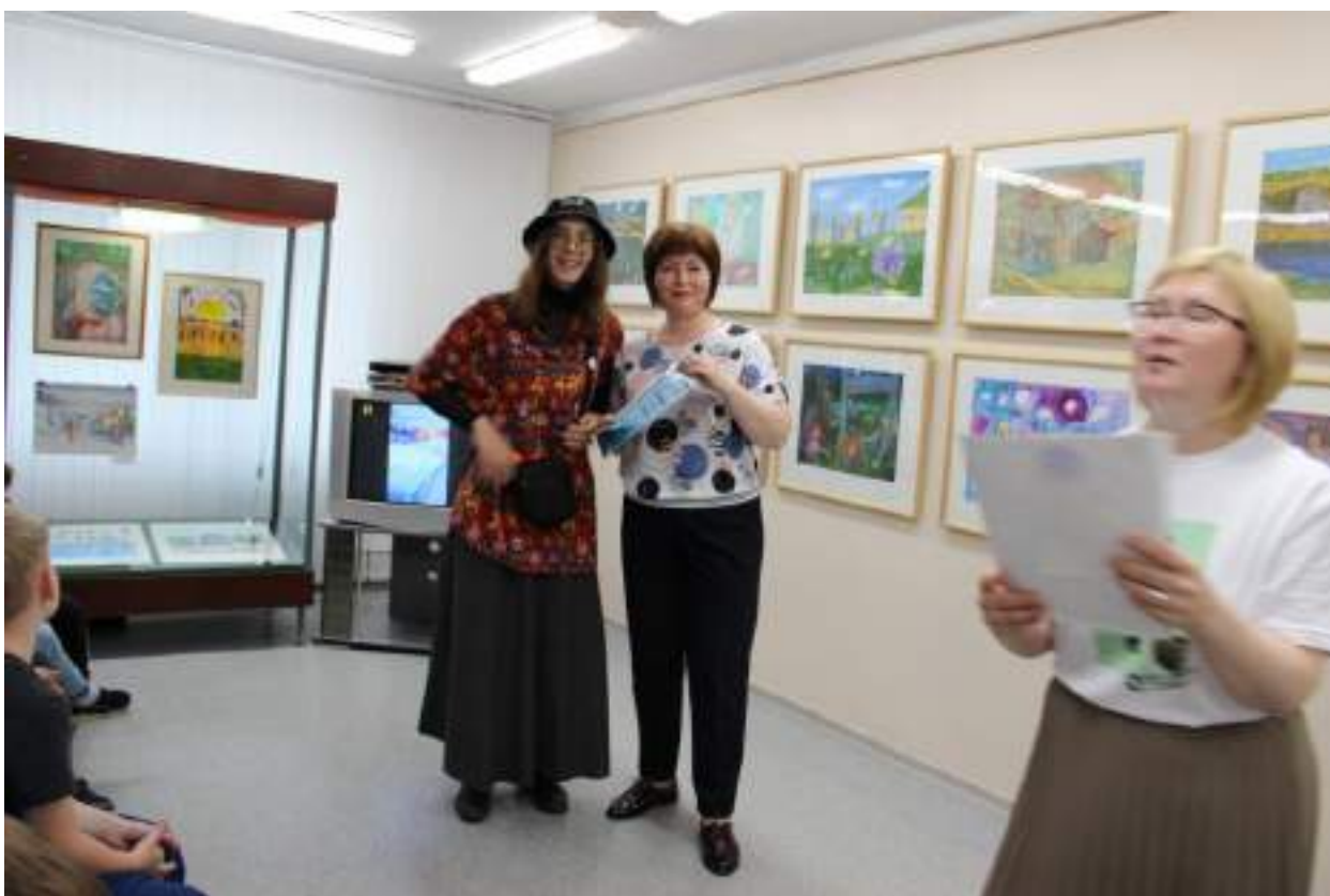
ЮМДИИ, открытие городской выставки детско-юношеского художественного творчества «Земля отцов», 2 июня