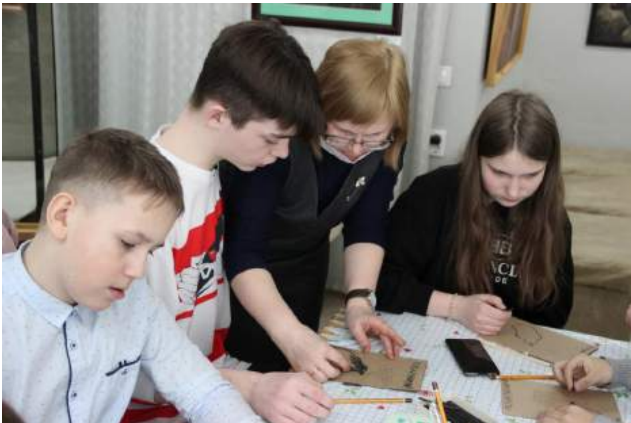
ЮМДИИ, культурно-развлекательная программа к 300-летию Кузбасса, март