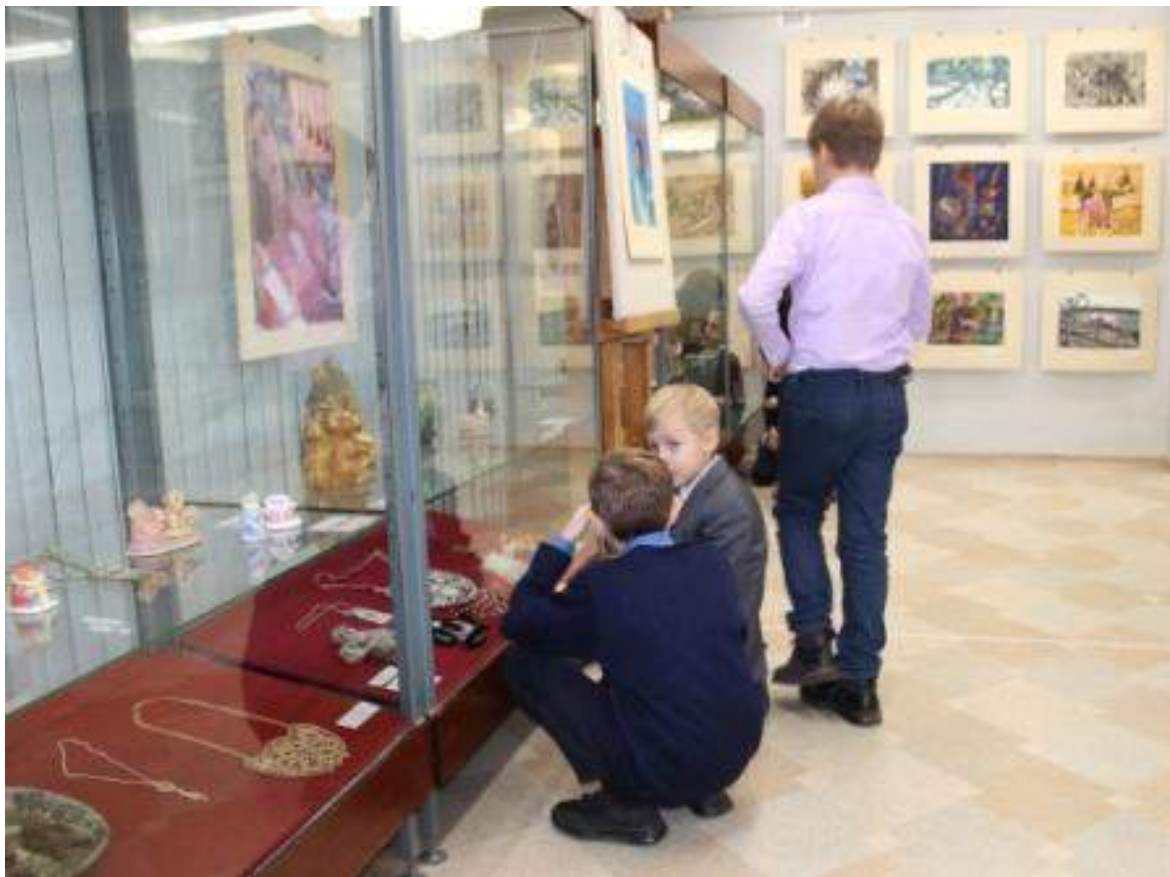
ЮМДИИ, на выставке «Сибирь. Мост культуры», сентябрь