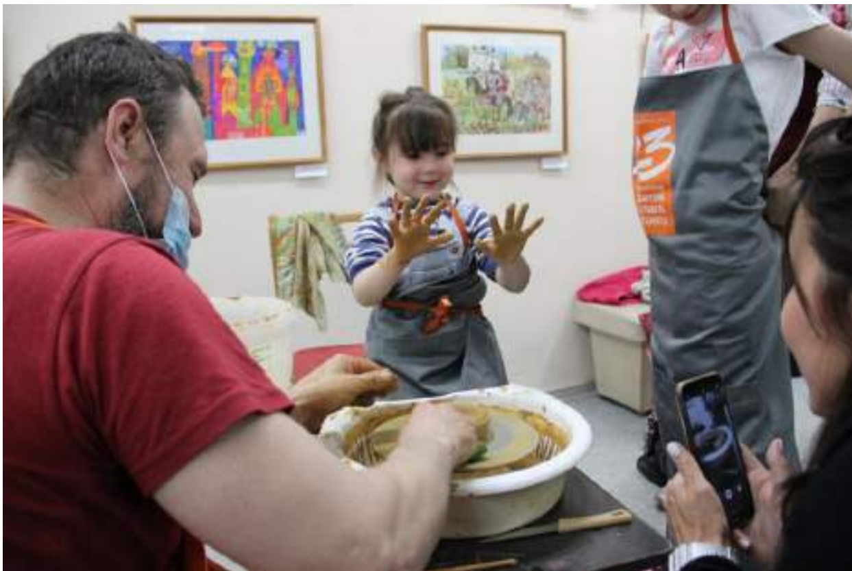
ЮМДИИ, Ночь музеев, 14 мая