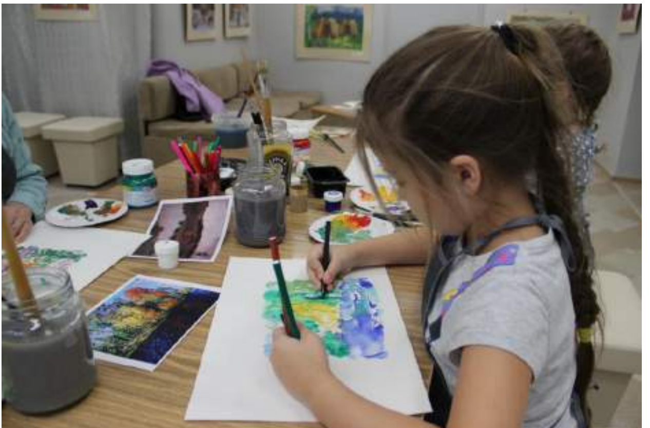
ЮМДИИ, всероссийская акция Ночь искусств, мастер-класс по монотипии «Осеннее отражение», 4 ноября