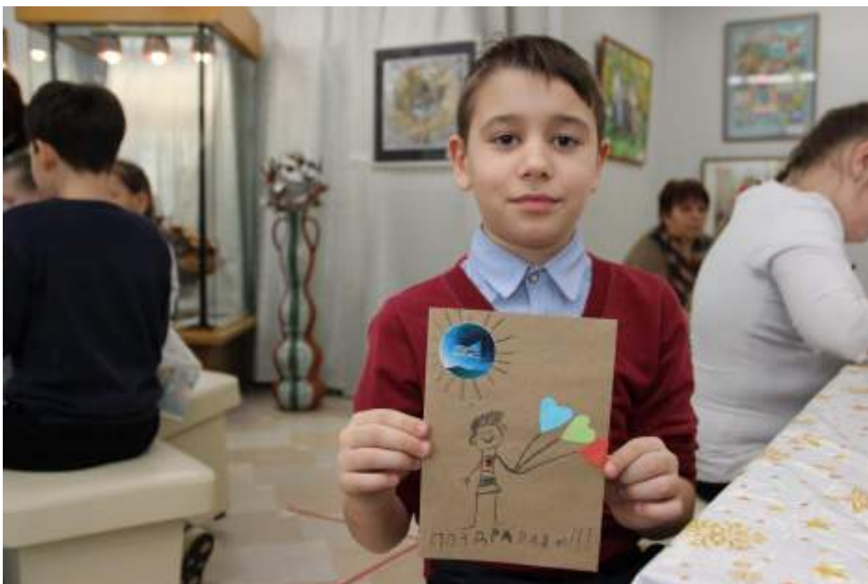
ЮМДИИ, культурно-развлекательная программа к 300-летию Кузбасса, март