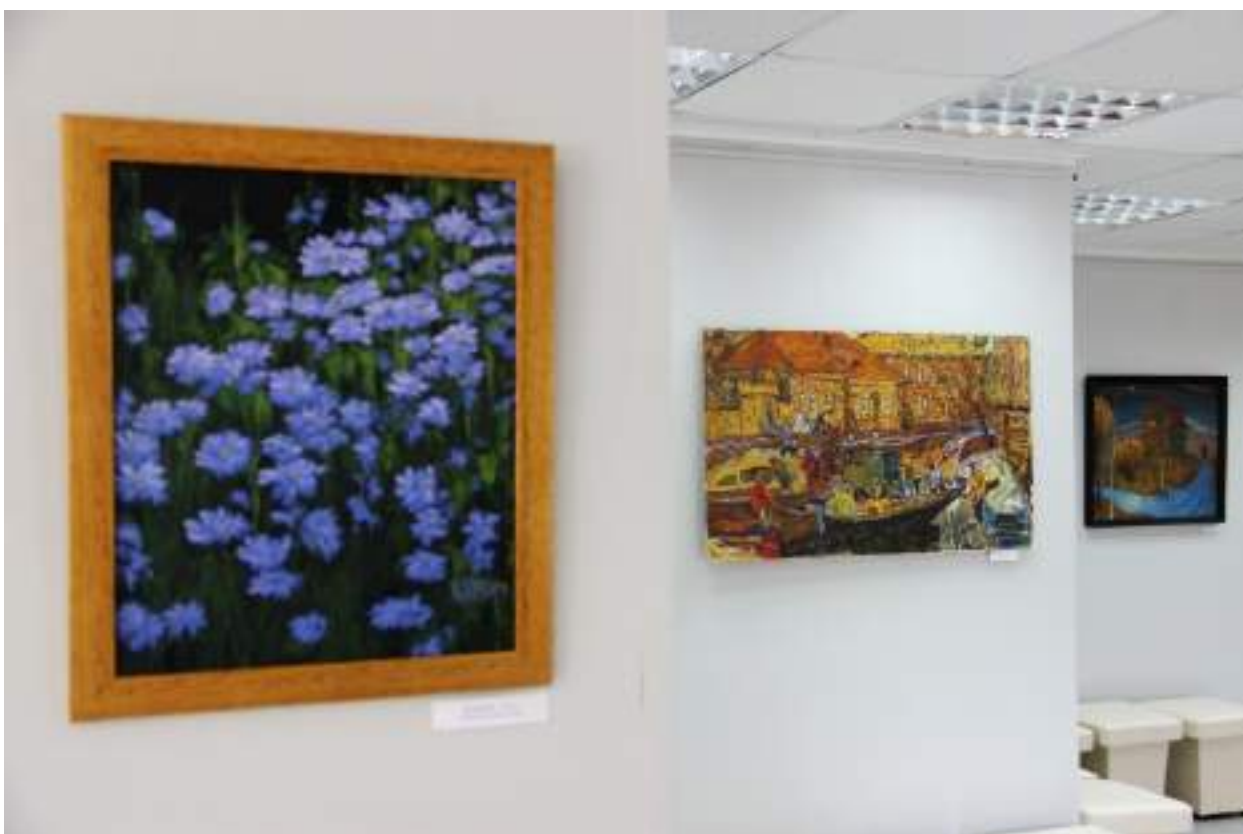
ЮМДИИ, выставка «Здесь отчий дом», июль