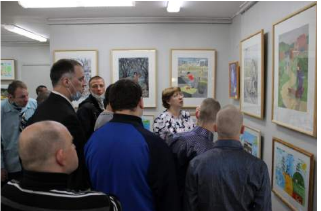
ЮМДИИ, экскурсия для проживающих в Психоневрологическом интернате, июнь