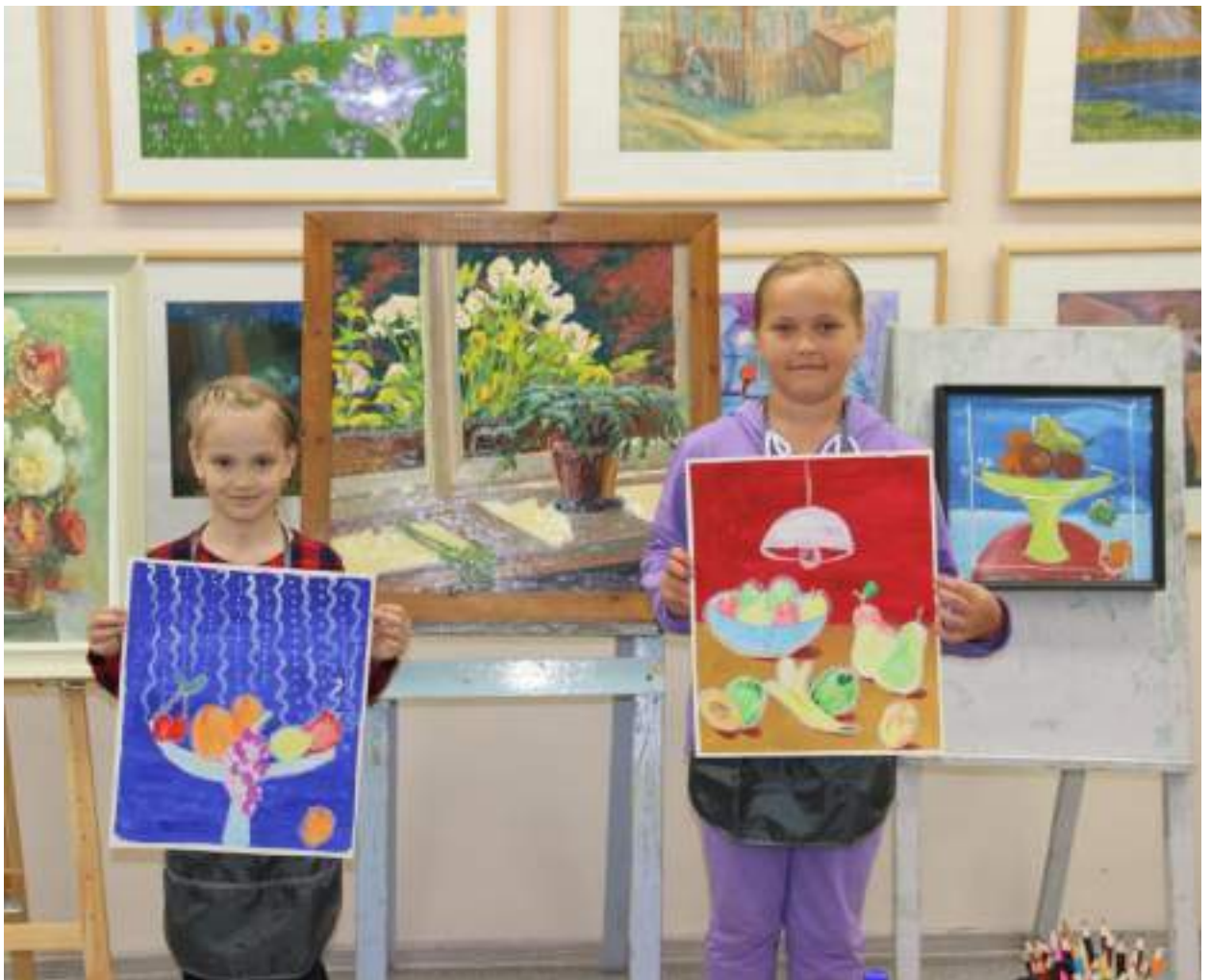
ЮМДИИ, занятие из цикла «Что такое натюрморт», июль