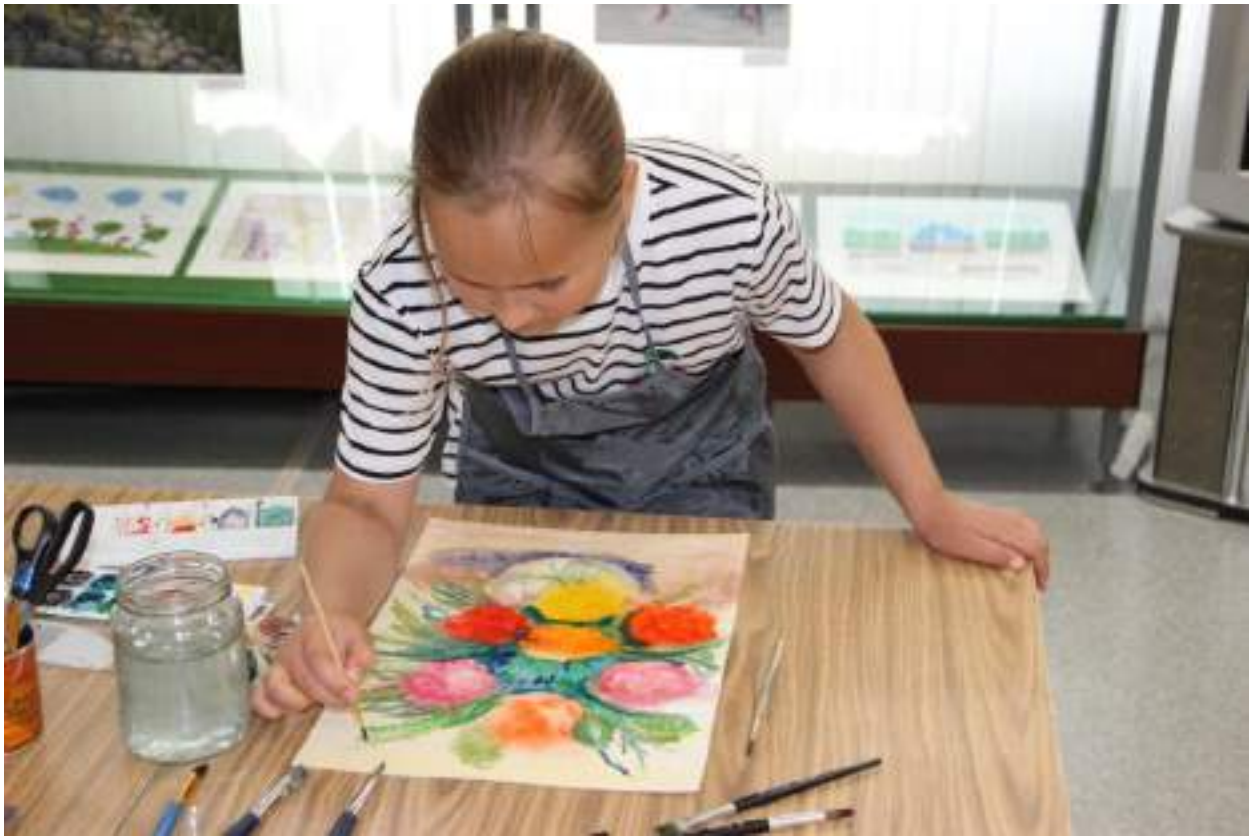
ЮМДИИ, занятие из цикла «Что такое натюрморт», июль