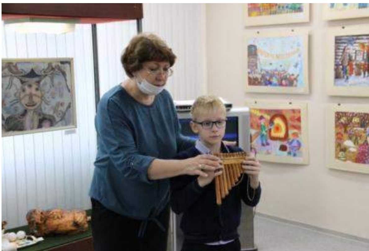
ЮМДИИ, занятие «Сибирь. Мост культуры», сентябрь