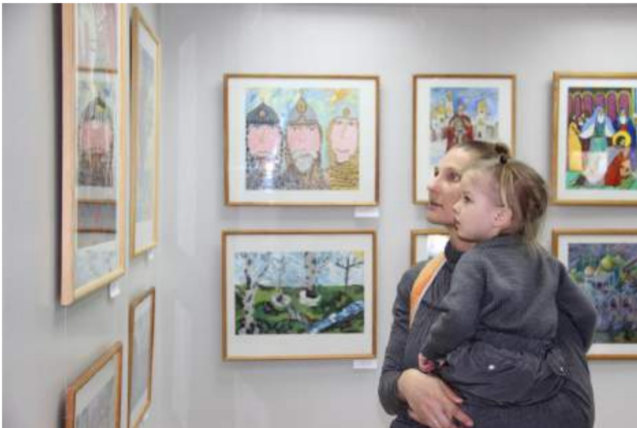
ЮМДИИ, посетители выставки «Сила земли русской», апрель