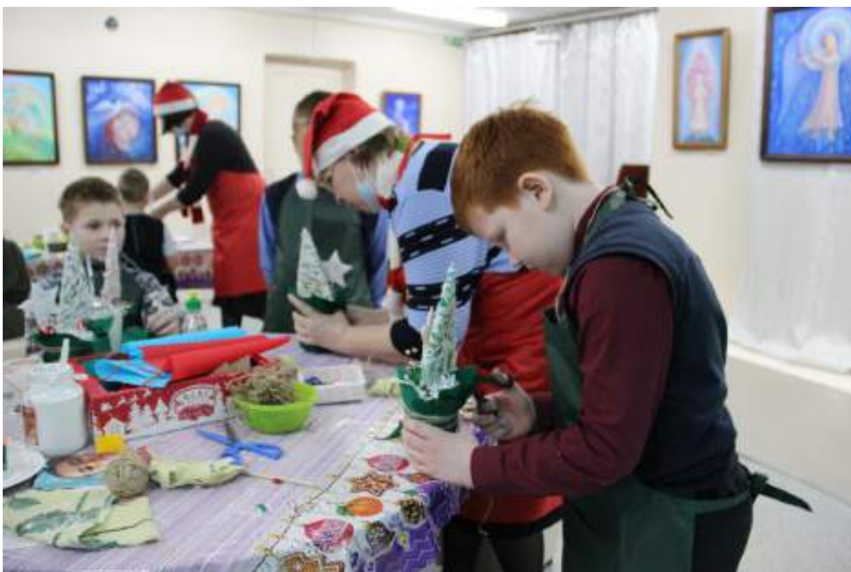
ЮМДИИ, праздничная программа «Волшебный чемоданчик», декабрь