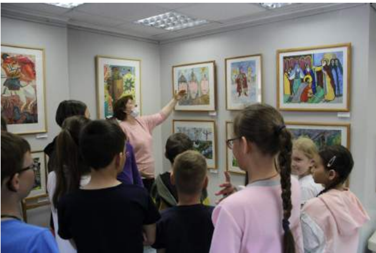
ЮМДИИ, экскурсия по выставке «Сила земли русской», апрель