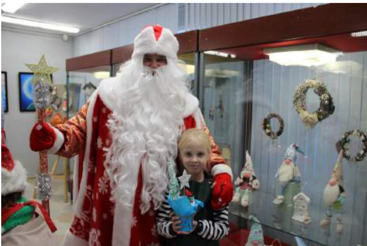
ЮМДИИ, праздничная программа «Волшебный чемоданчик», декабрь