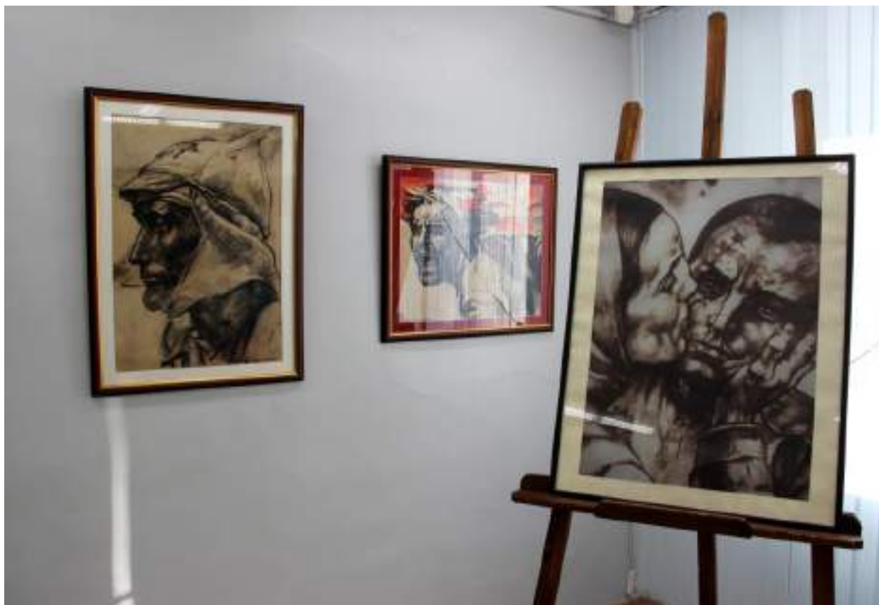
ЮМДИИ, выставка Г. Захарова «Пою мое Отечество», февраль