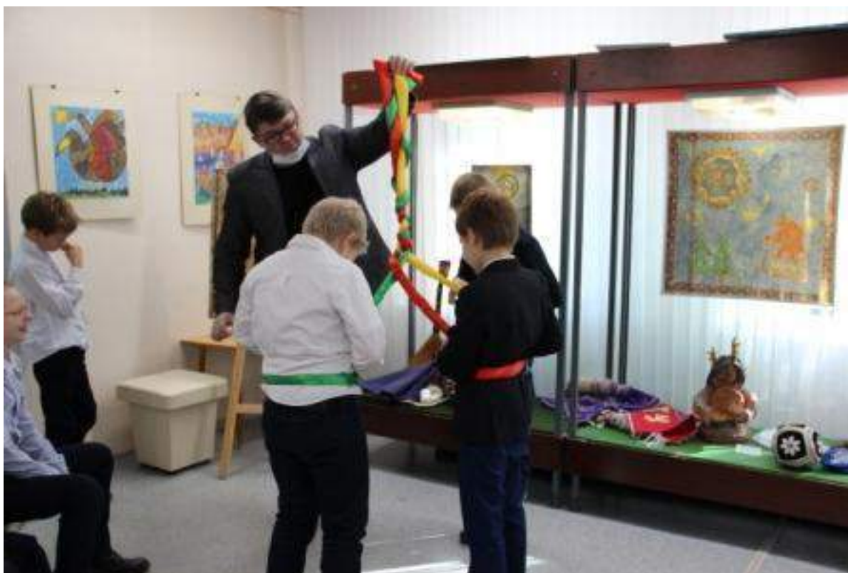
ЮМДИИ, занятие «Сибирь. Мост культуры», сентябрь