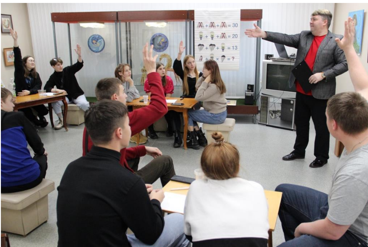
ЮМДИИ, Интеллектуальная игра «Эрудит-квиз», 15 ноября