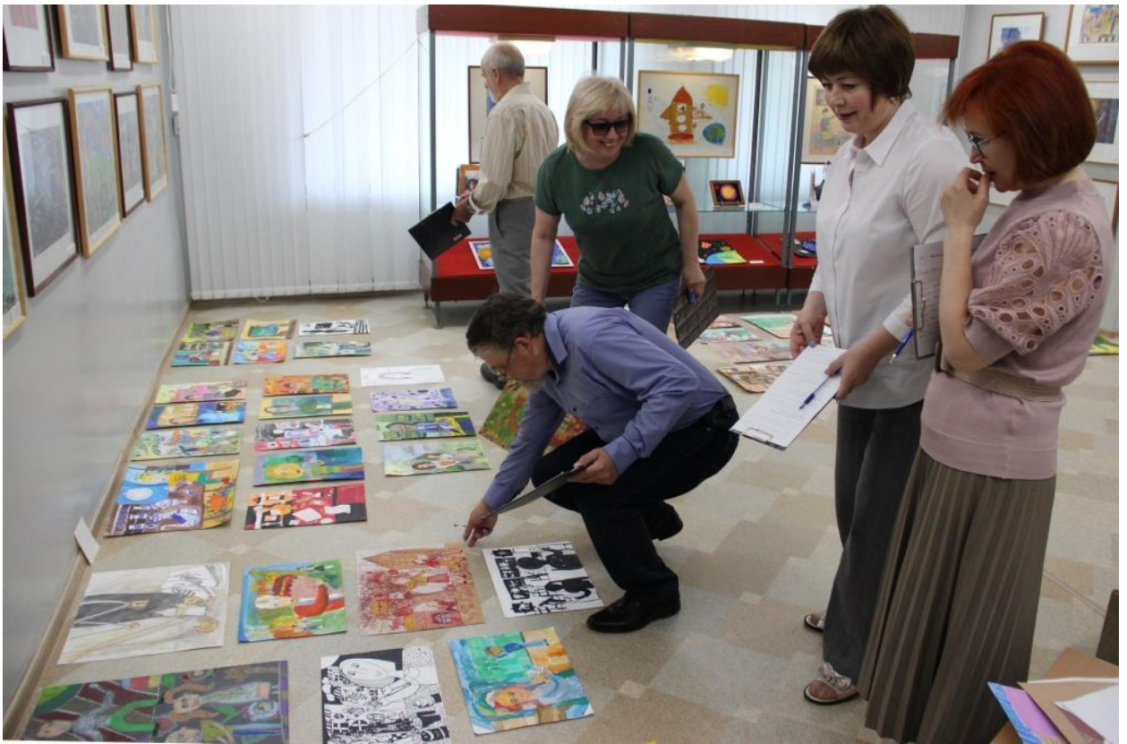
ЮМДИИ, жюри областного конкурса «Учитель – искусство дарить свет», июнь