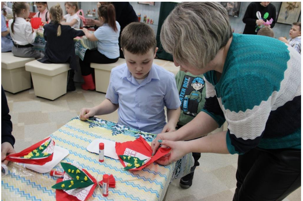
ЮМДИИ, культурно-развлекательная программа «Светлый день 8 марта», март