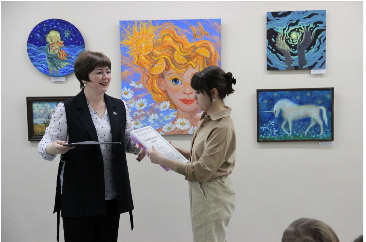
ЮМДИИ, открытие выставки «Формула света», 17 ноября