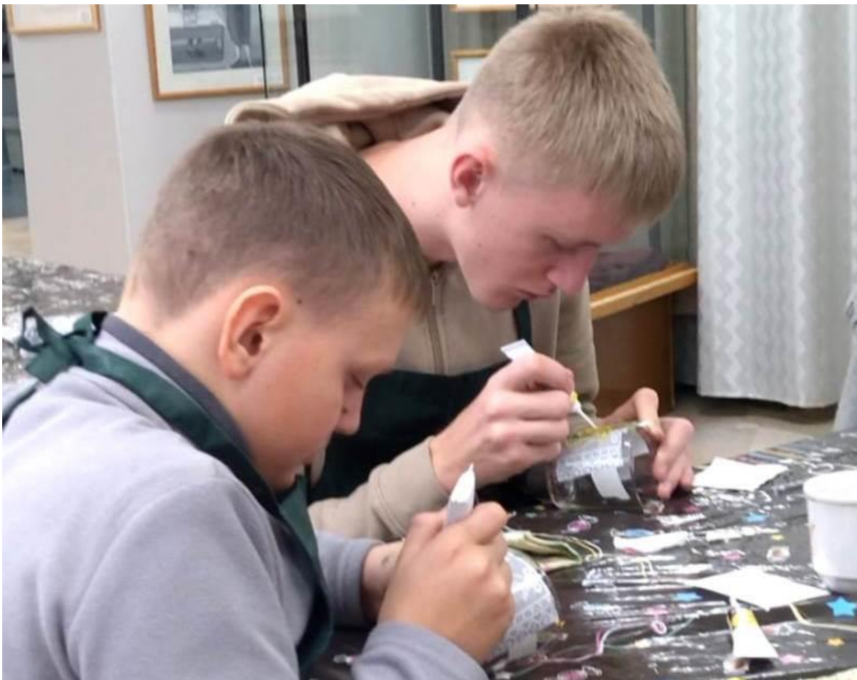
ЮМДИИ, мастер-класс «Дивная птица», 4 ноября