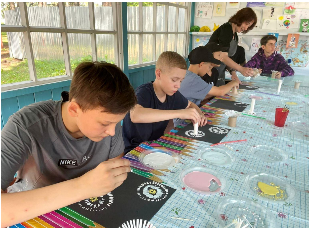
ЮМДИИ, мастер-класс в оздоровительном лагере «Салют», 17 июля