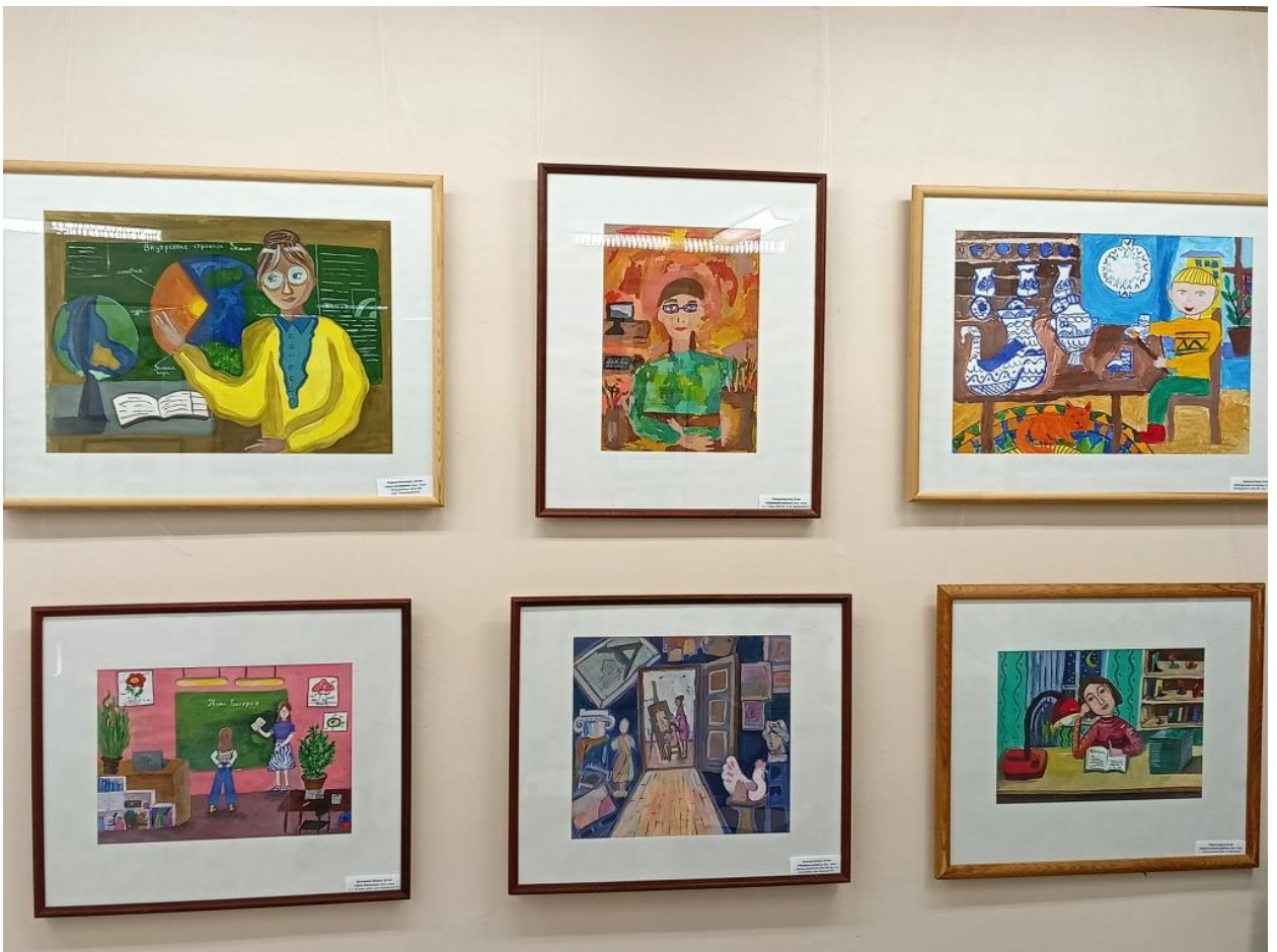
ЮМДИИ, областная выставка «Учитель – искусство дарить свет», сентябрь - ноябрь