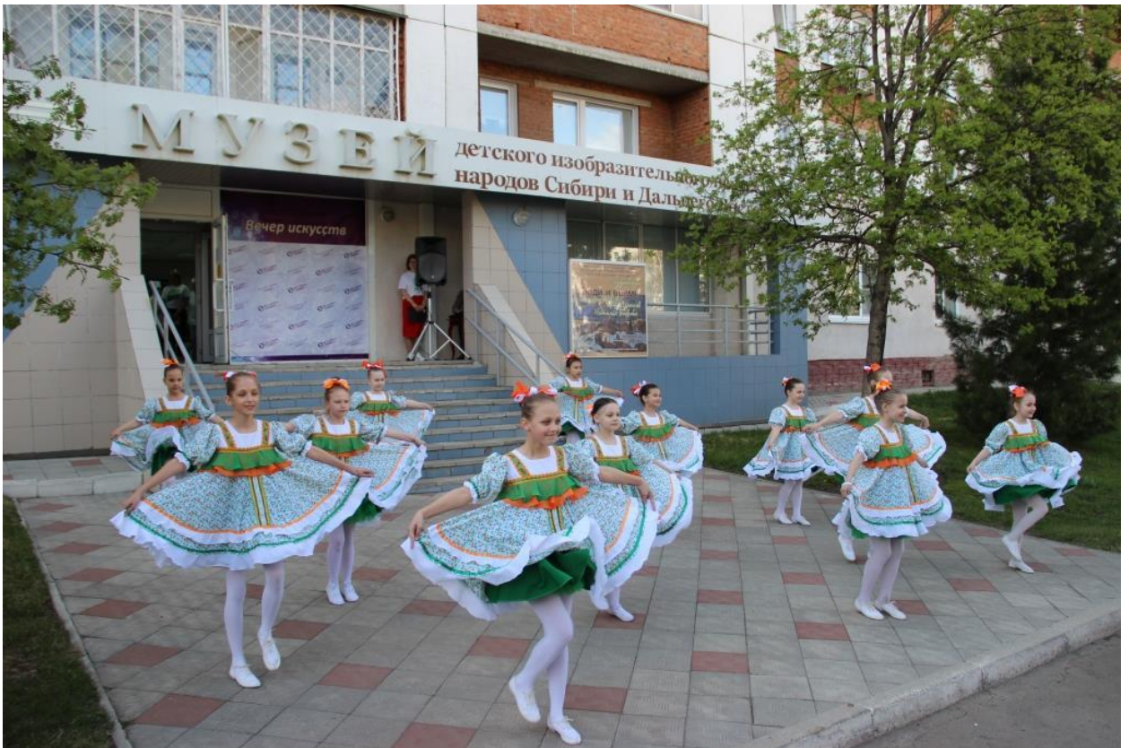
ЮМДИИ, «Ночь музеев», 19 мая