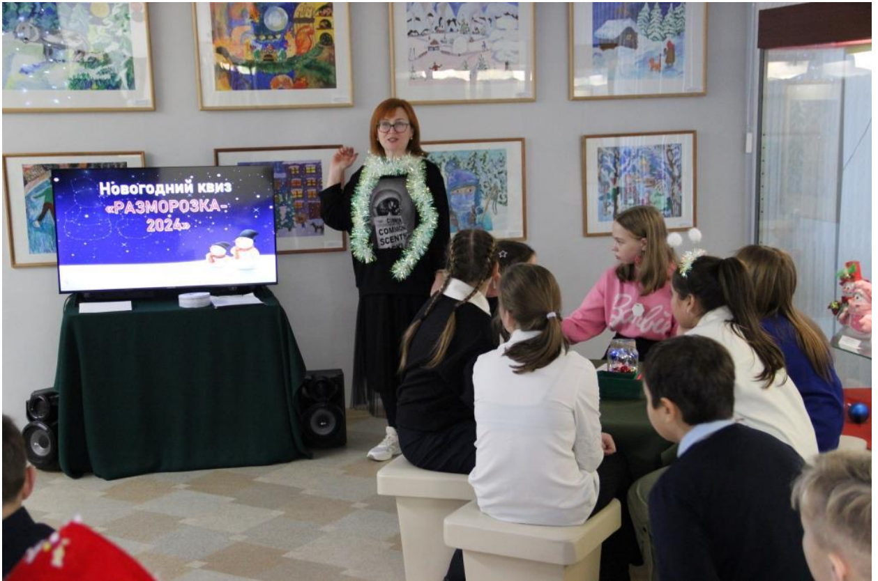
ЮМДИИ, новогодний квіз «Разморозка», декабрь