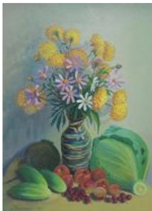
ЮМДИИ, Макрушин Е. И. (г.р.1931) «Натюрморт», 1994. ДВП, масло 72,0 x 53,0 см (г. Юрга, Кемеровская область-Кузбасс)

Работа займёт достойное место в фонде музея и пополнит формирующуюся коллекцию «Живопись и графика художников Кузбасса в собрании ЮМДИИ».