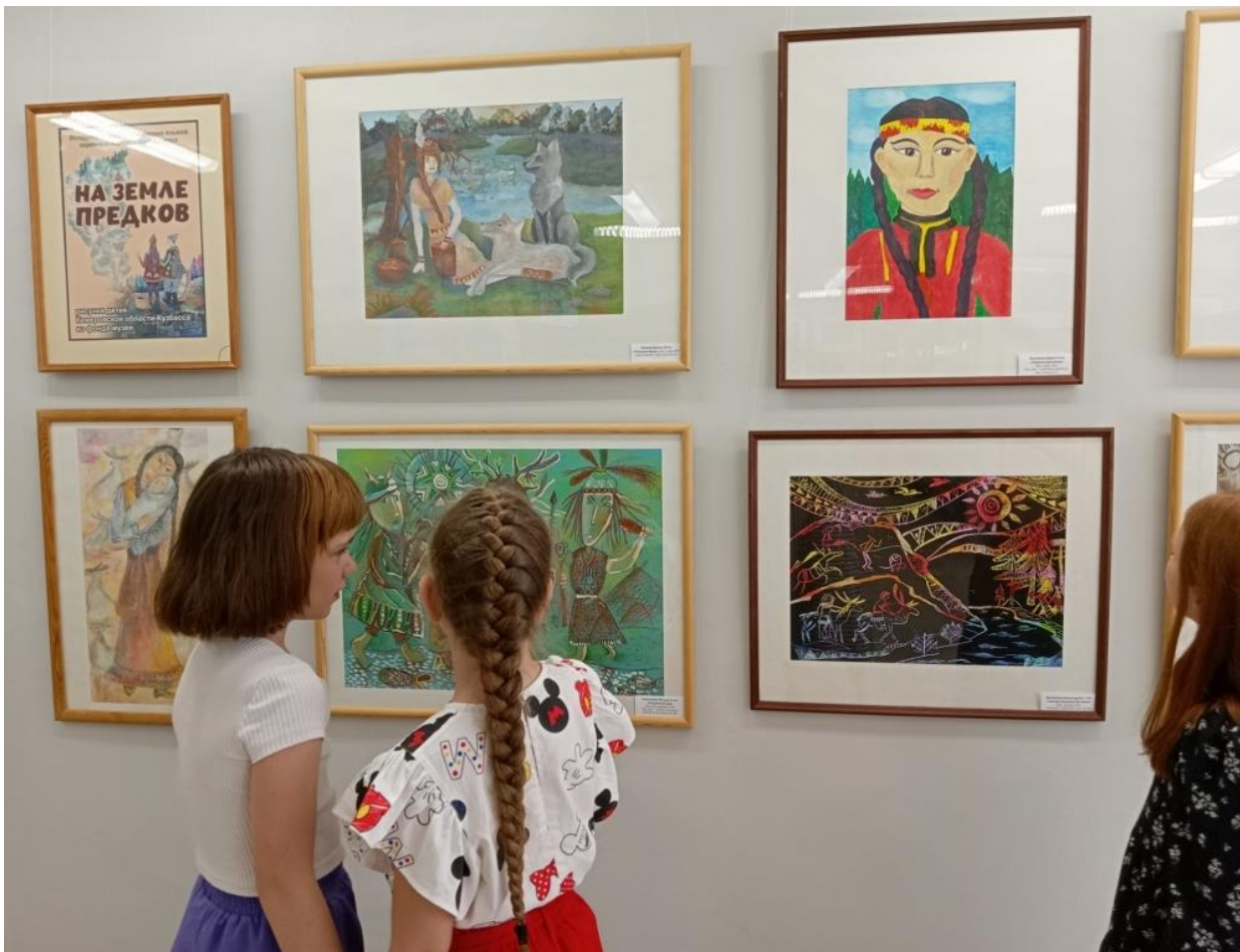
ЮМДИИ, выставка «На земле предков», июнь-август