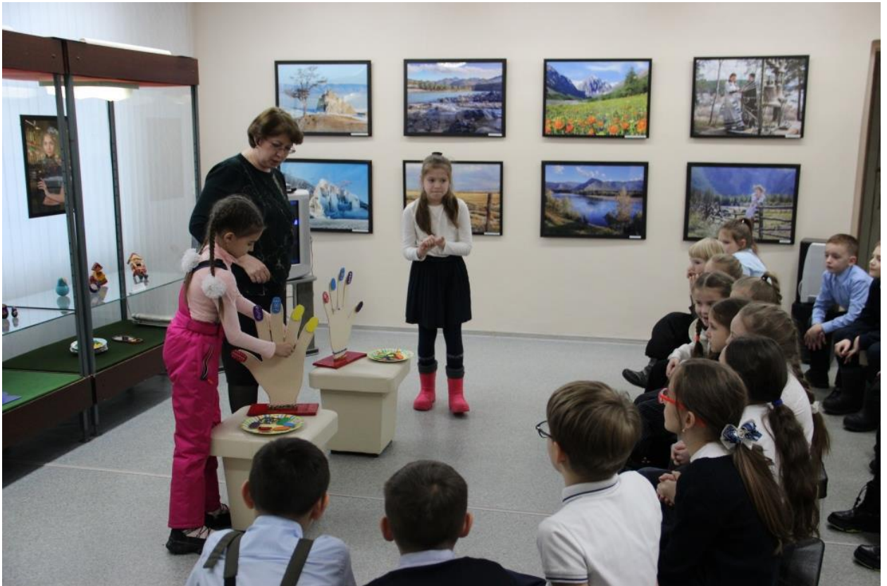
ЮМДИИ, культурно-развлекательная программа «Светлый день 8 марта», март