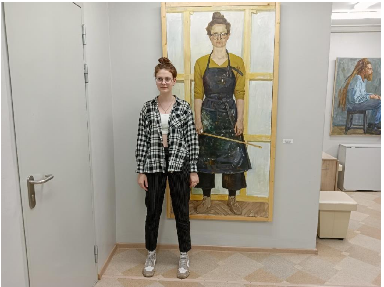
ЮМДИИ, посетительница выставки «Люди и время», апрель