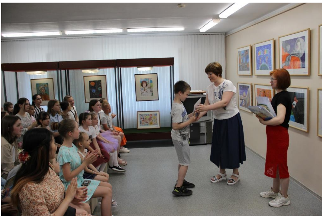
ЮМДИИ, открытие выставки и награждение победителей конкурса «Навстречу звездам», 2 июня