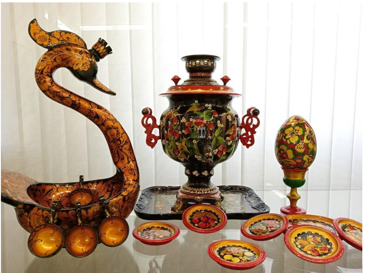
ЮМДИИ, выставка «Диво дивное – красота народная», апрель-май