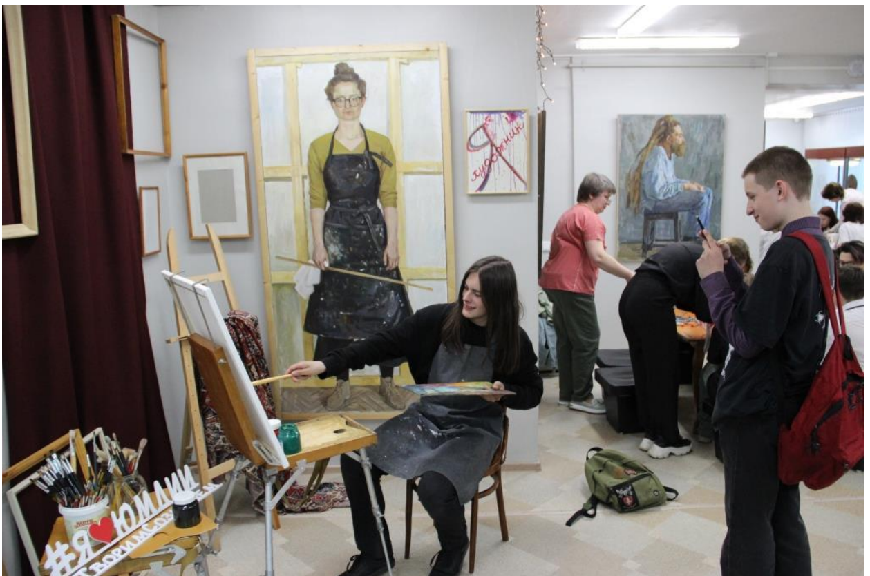
ЮМДИИ, «Ночь музеев», 19 мая