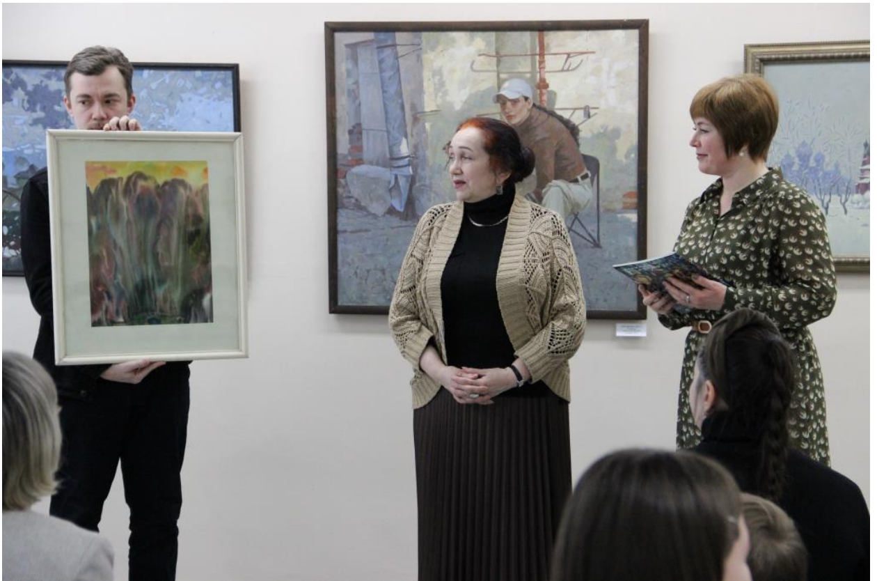
ЮМДИИ, открытие выставки «Люди и время», апрель