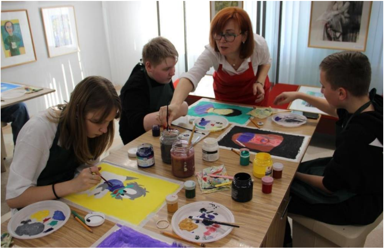
ЮМДИИ, мастер-класс «Позитивный поп-арт», июль