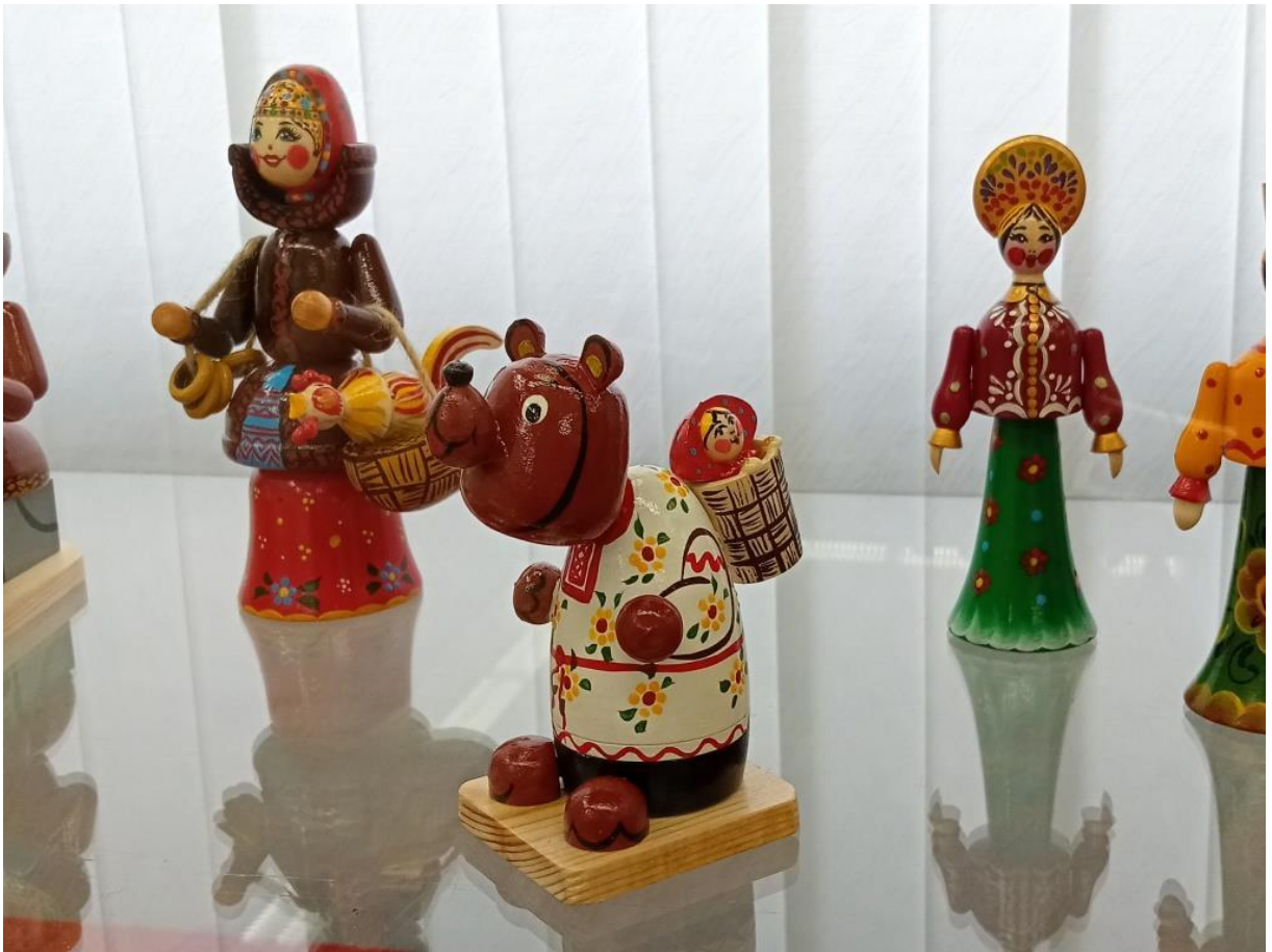
ЮМДИИ, выставка «Деревянные и расписные», февраль-март