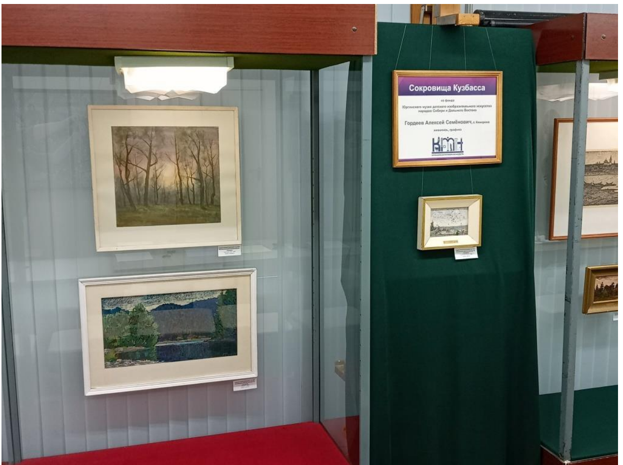
ЮМДИИ, выставка «Сокровища Кузбасса из фонда ЮМДИИ», май