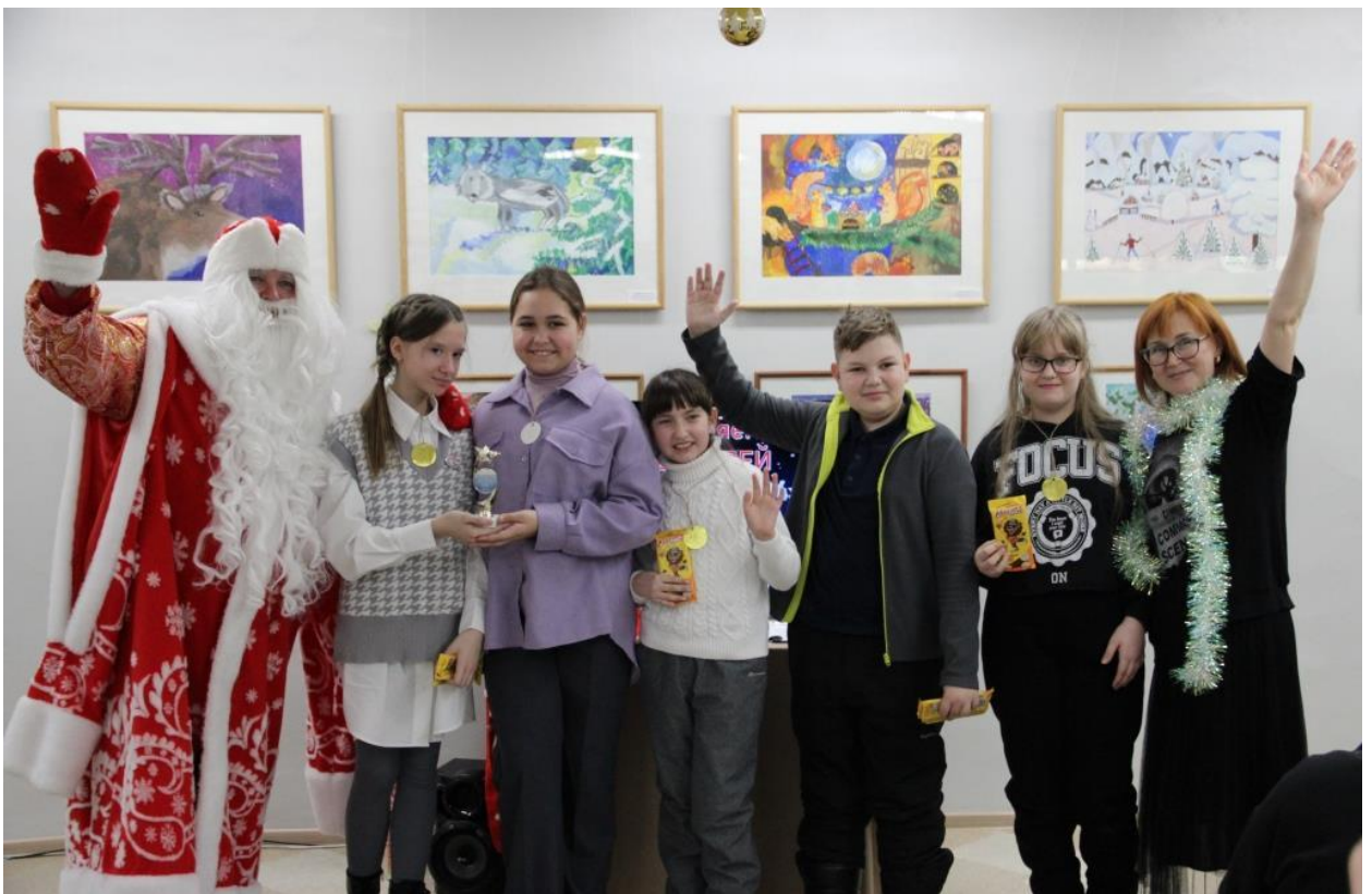
ЮМДИИ, новогодний квіз «Разморозка», декабрь