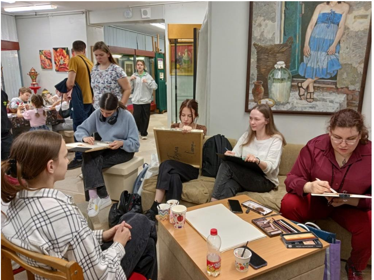
ЮМДИИ, «Ночь музеев», 19 мая