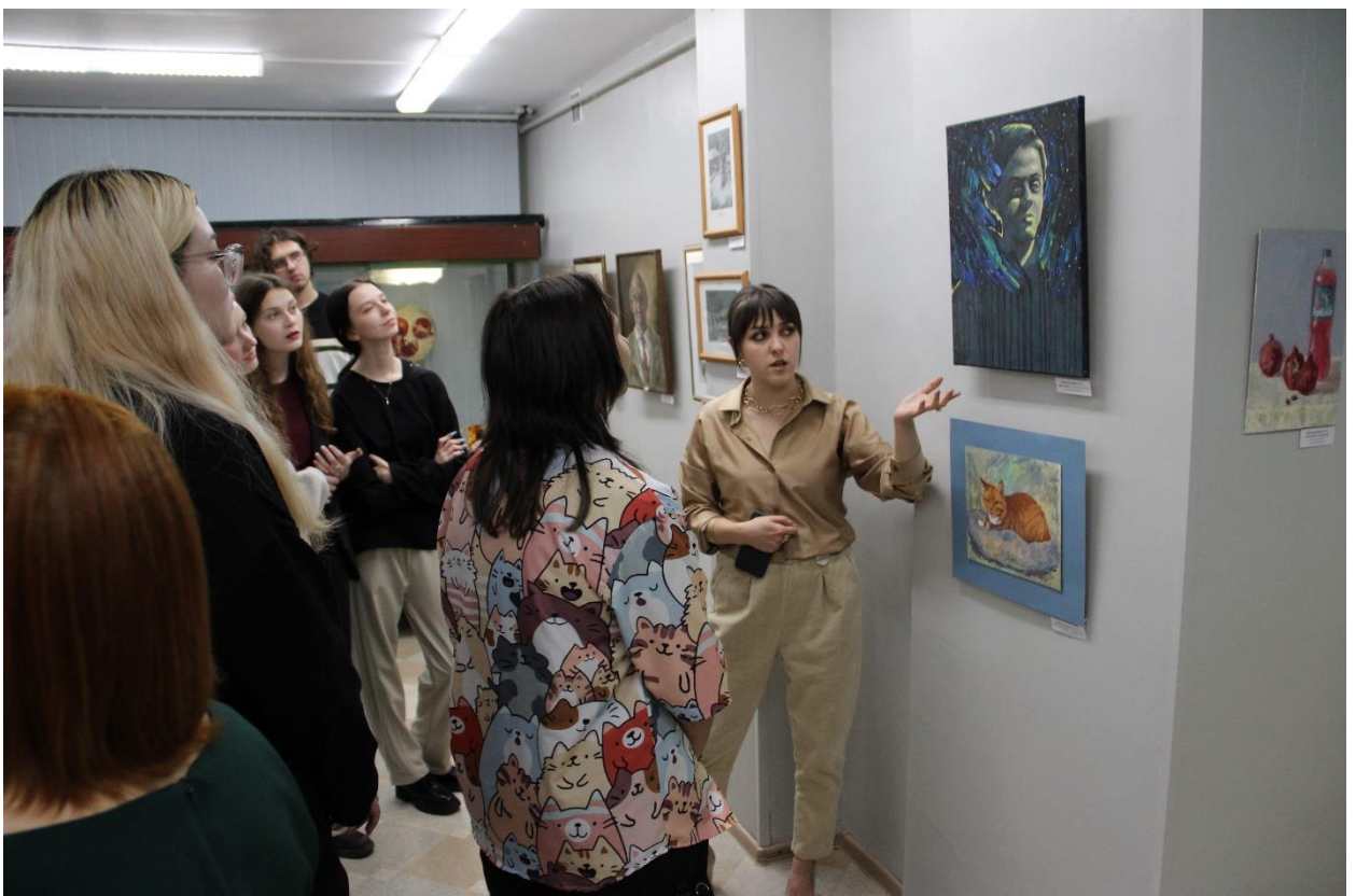
ЮМДИИ, экскурсия от автора выставки «Формула света», 17 ноября