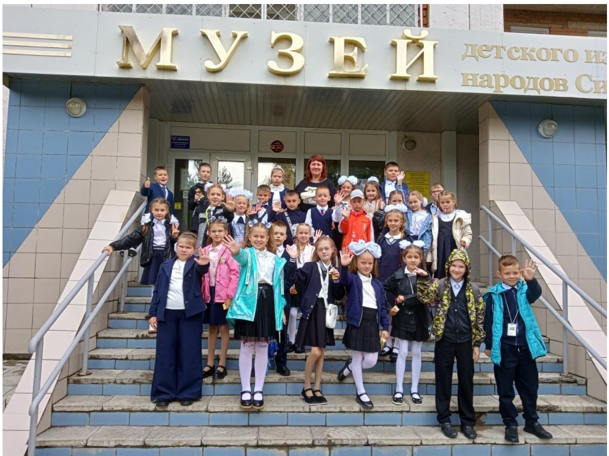
ЮМДИИ, праздничная программа «Звенит звонок веселый», 1 сентября