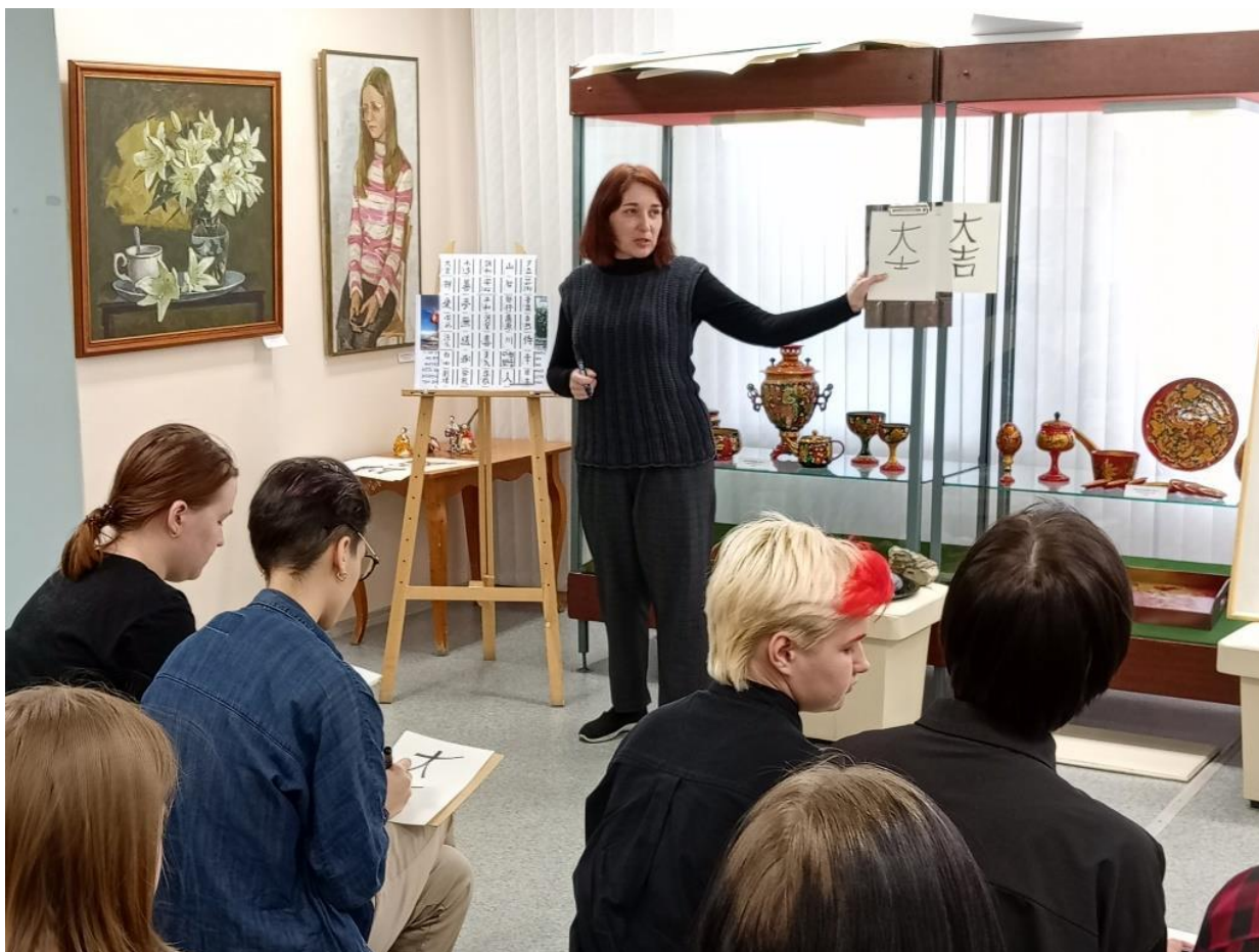
ЮМДИИ, культурная программа «Страна восходящего солнца», май