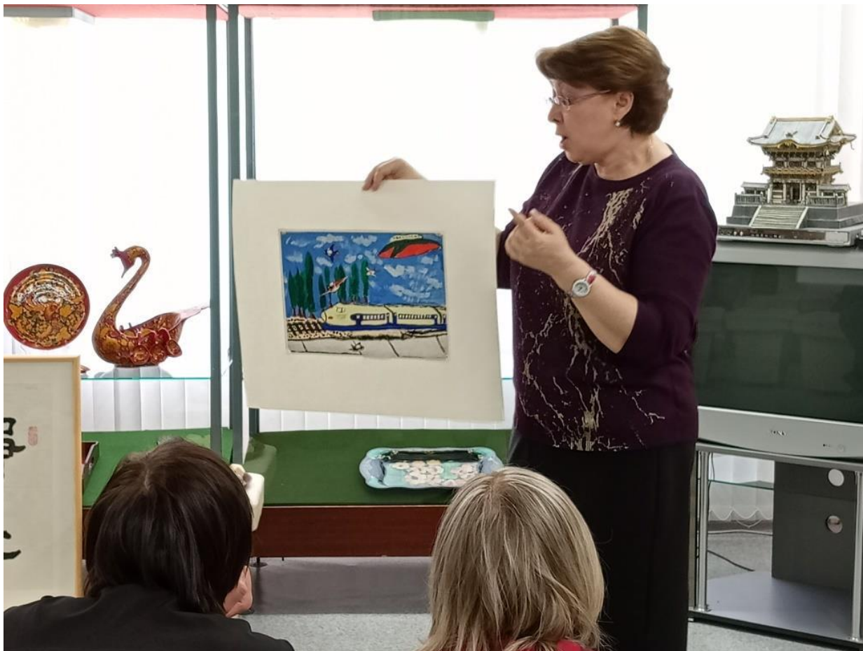
ЮМДИИ, культурная программа «Страна восходящего солнца», май