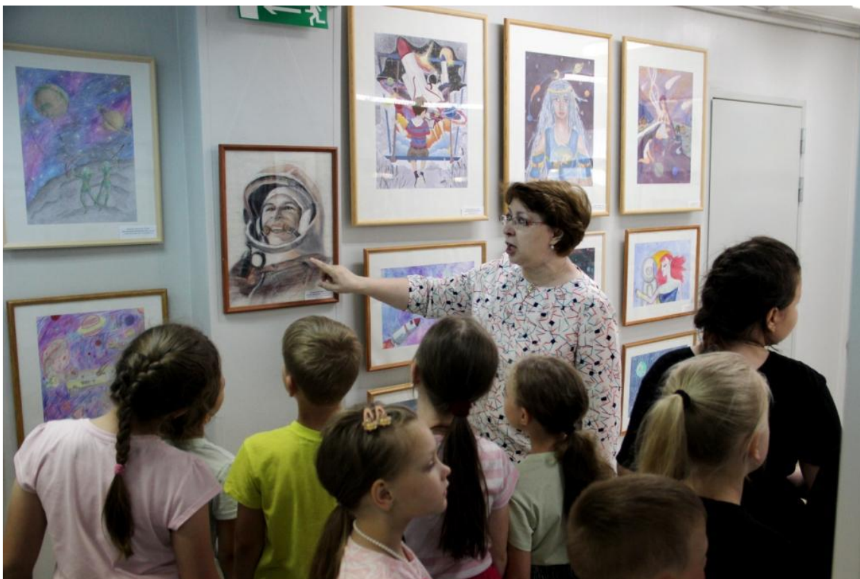
ЮМДИИ, экскурсия по выставке «Навстречу звездам», июнь