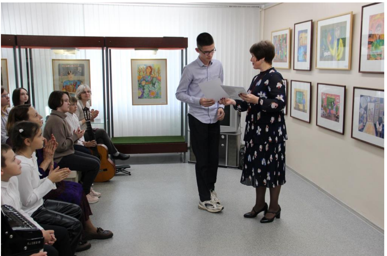
ЮМДИИ, награждение победителей областного конкурса «Учитель – искусство дарить свет», 26 сентября