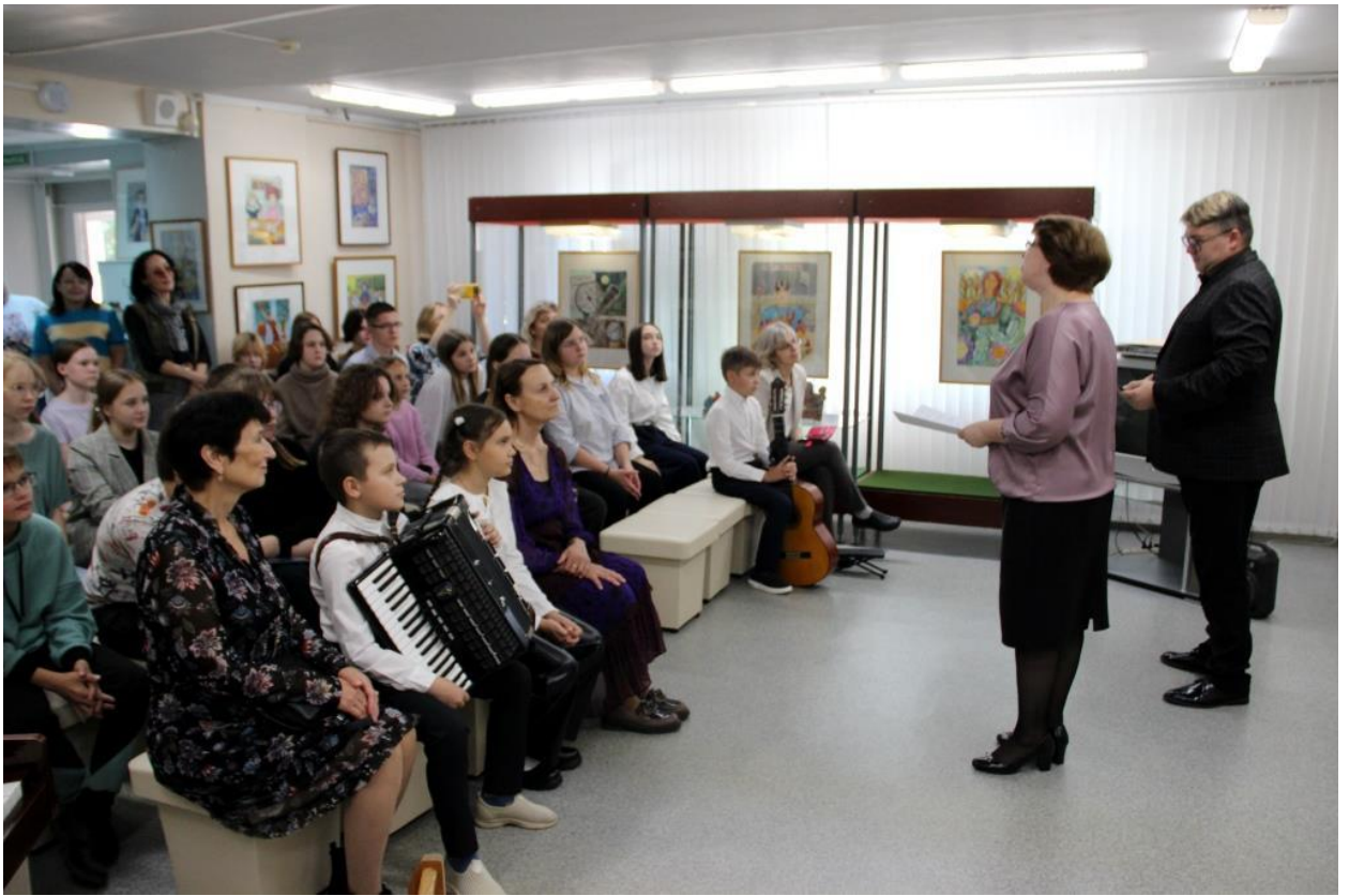
ЮМДИИ, открытие областной выставки «Учитель – искусство дарить свет», 26 сентября