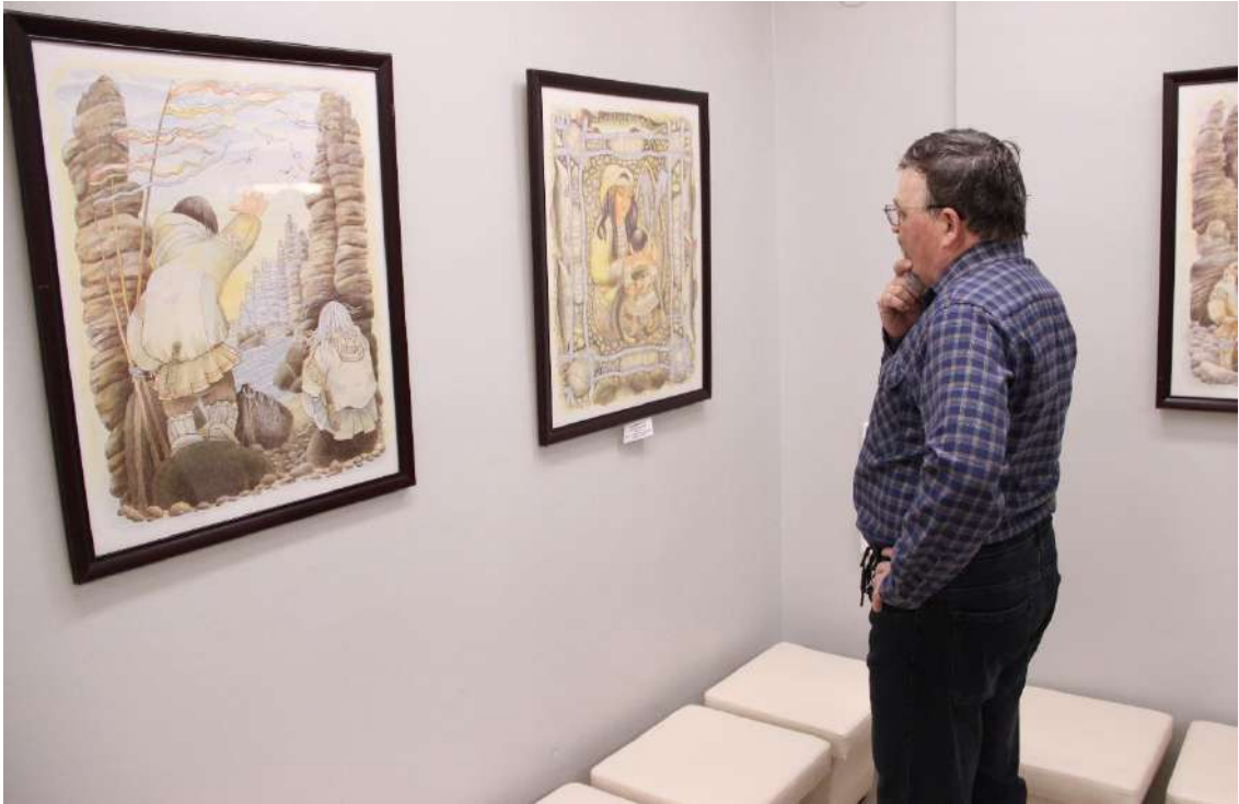
ЮМДИИ, выставка «Прекрасный мой Элим», март