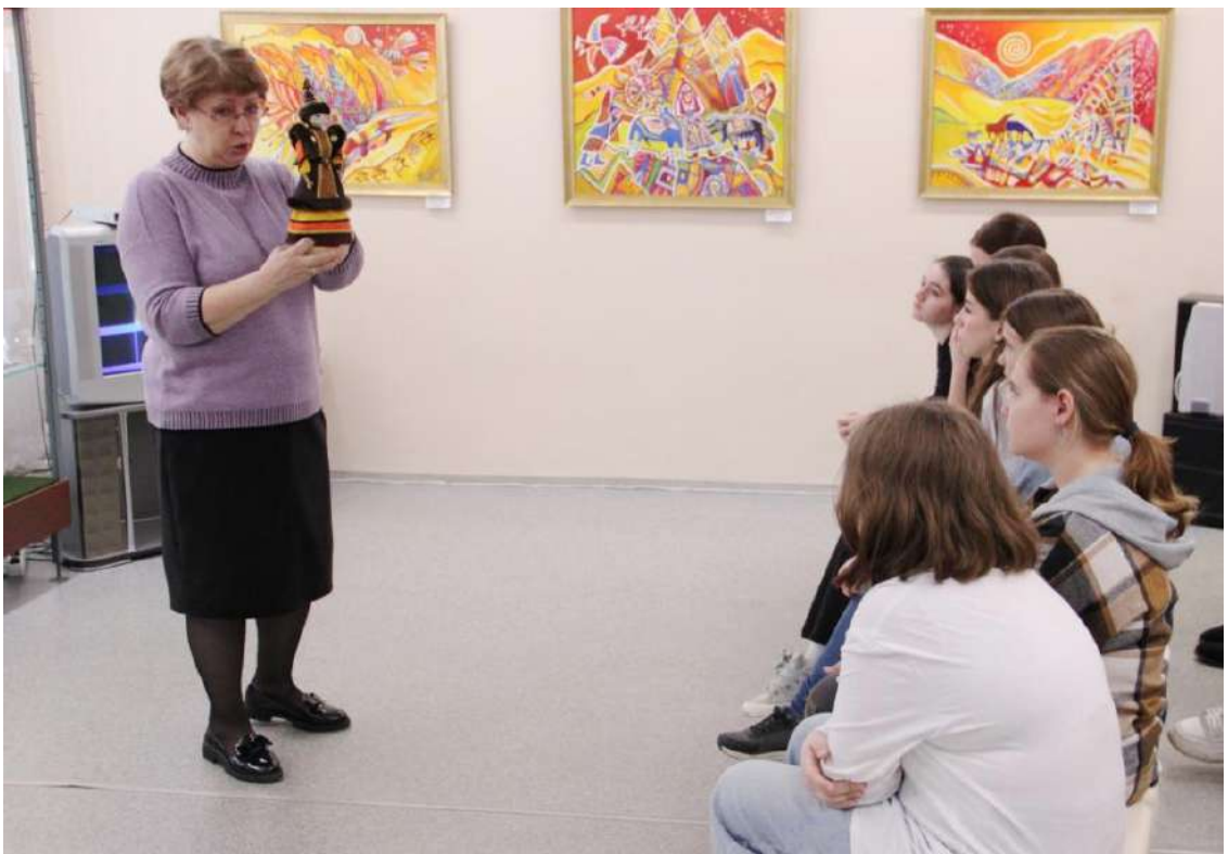
ЮМДИИ, занятие «Мы живем в Кузбассе», март