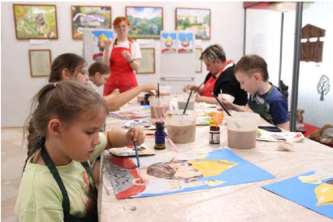
ЮМДИИ, мастер-класс «Русский богатырь», июль