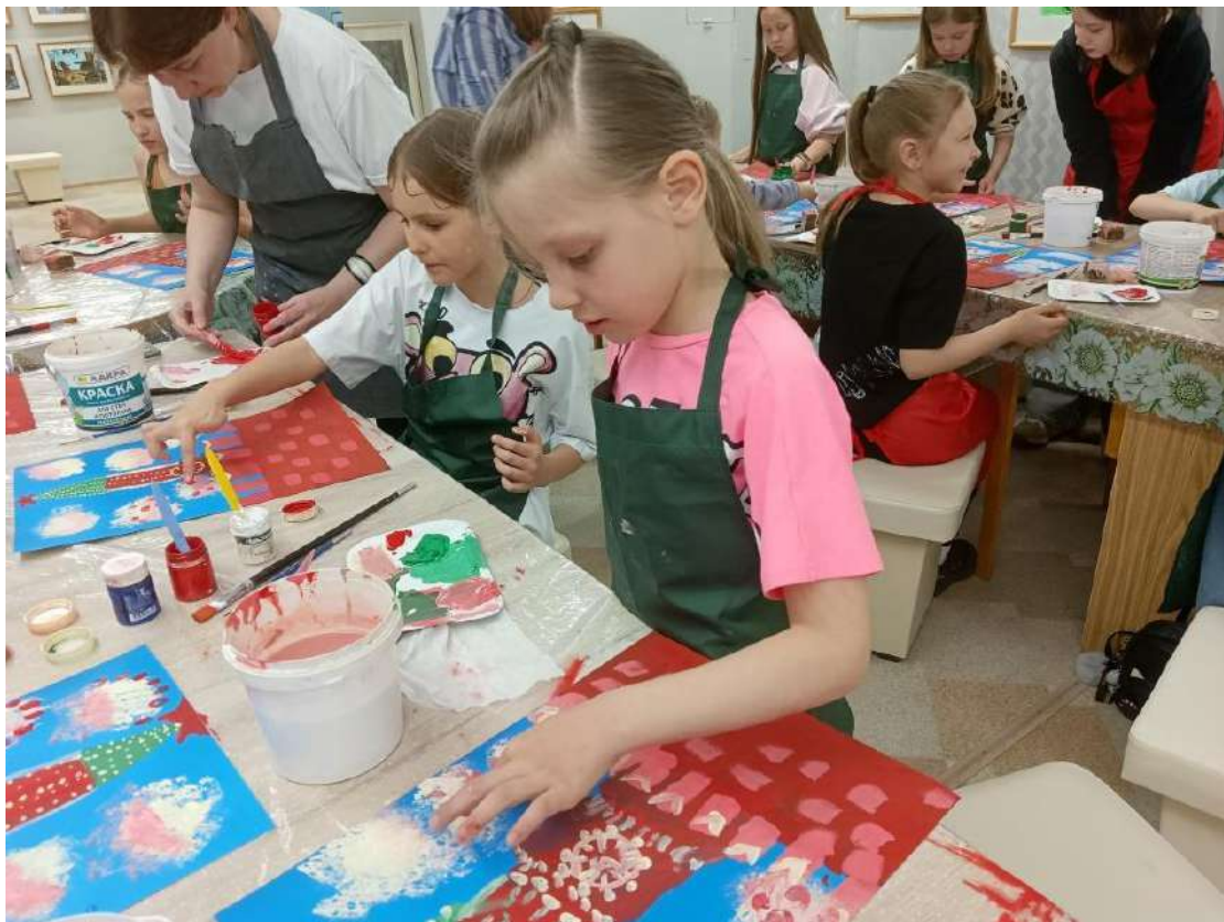
ЮМДИИ, «Ночь музеев», 17 мая