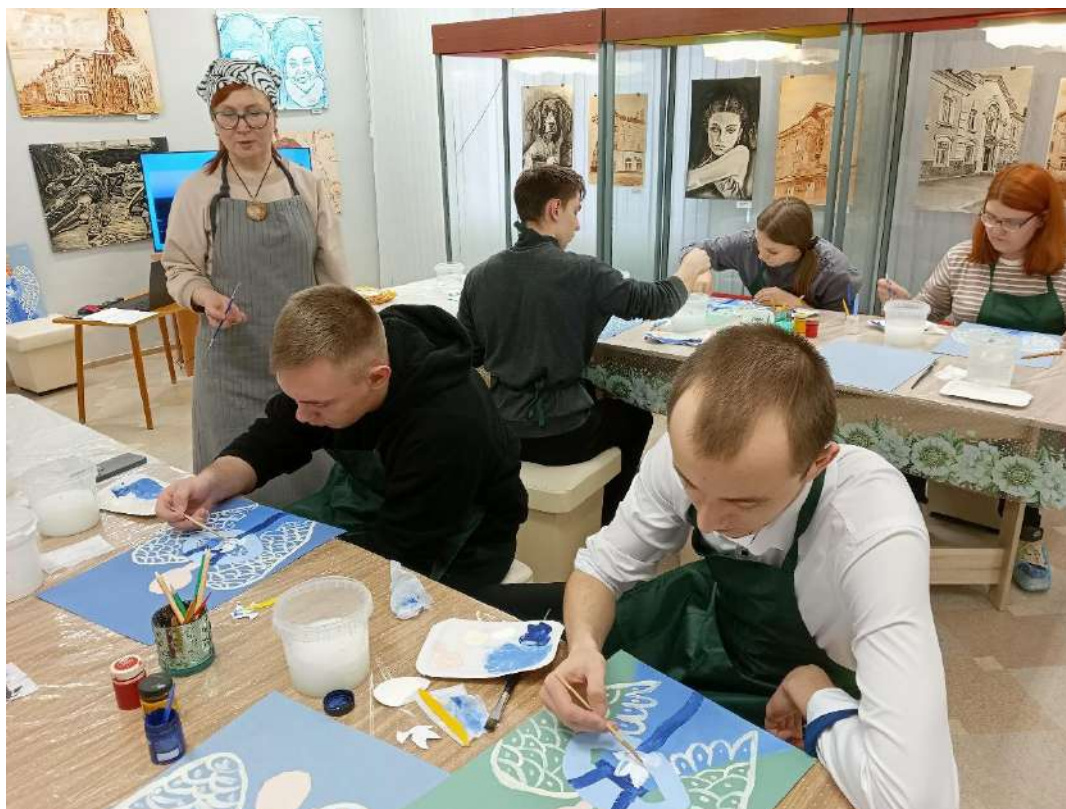
ЮМДИИ, мастер-класс «Ангел мира», апрель