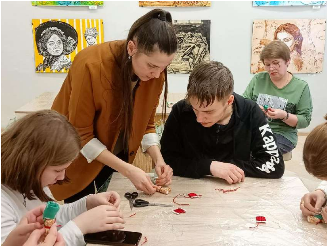
ЮМДИИ, занятие «Мы живем в Кузбассе», март