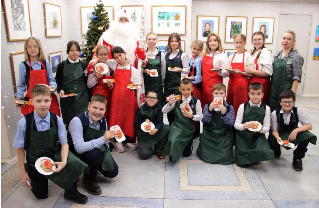
ЮМДИИ, культурная программа «Новогодний сувенир», декабрь