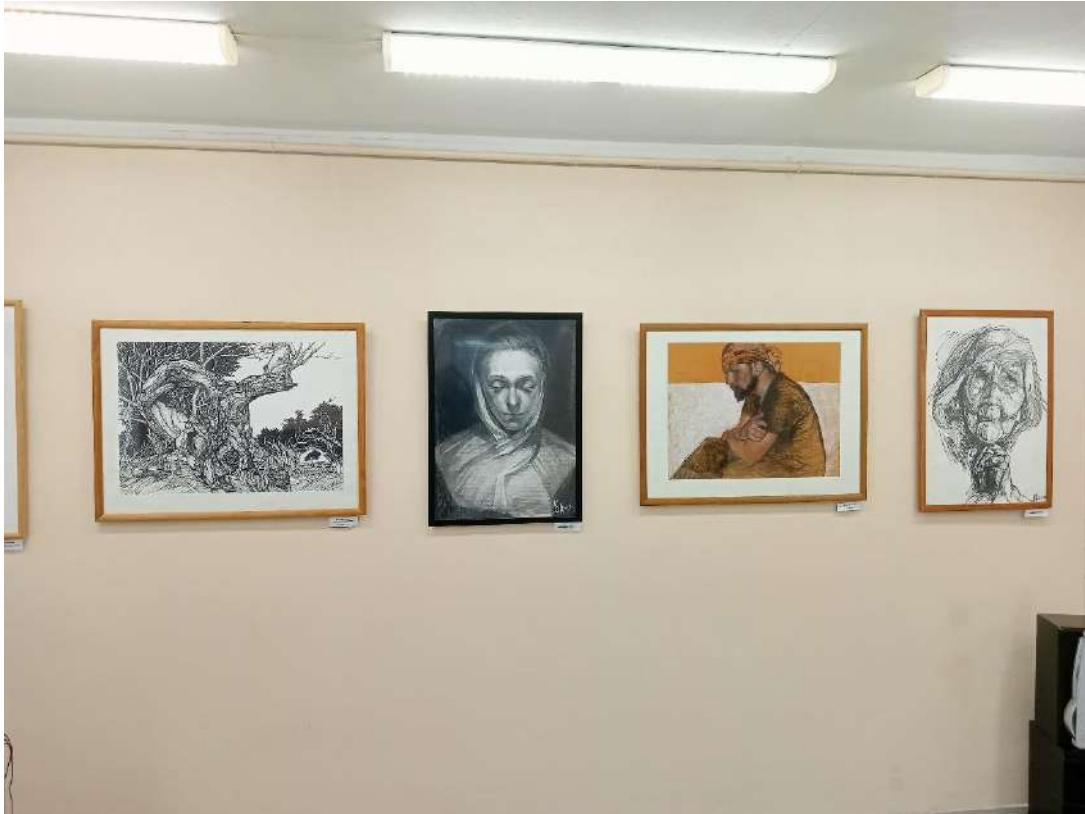
ЮМДИИ, выставка «Мой путь», сентябрь-ноябрь