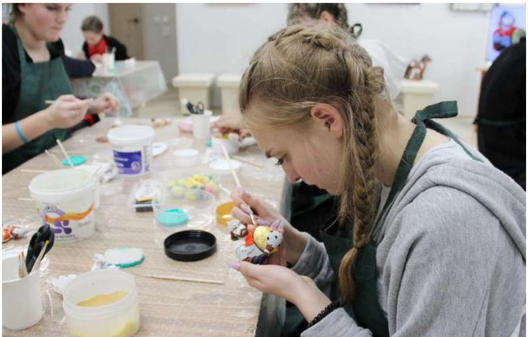
ЮМДИИ, культурная программа «Защитники земли русской», ноябрь