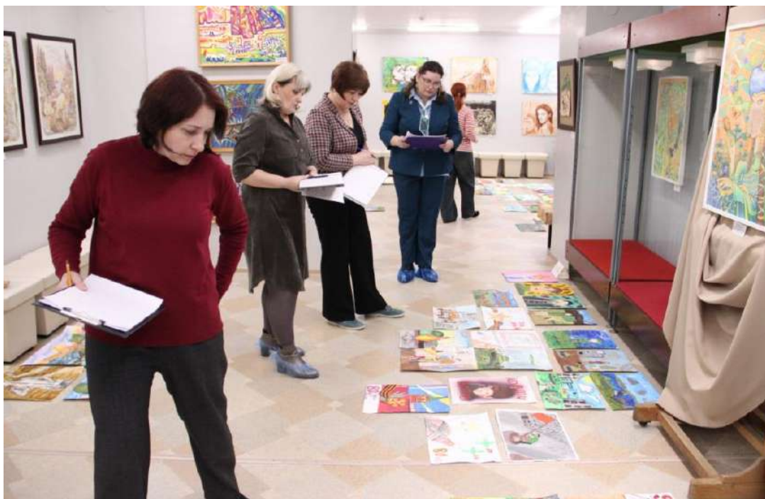
ЮМДИИ, работа жюри городского конкурса «О войне и о Победе», апрель