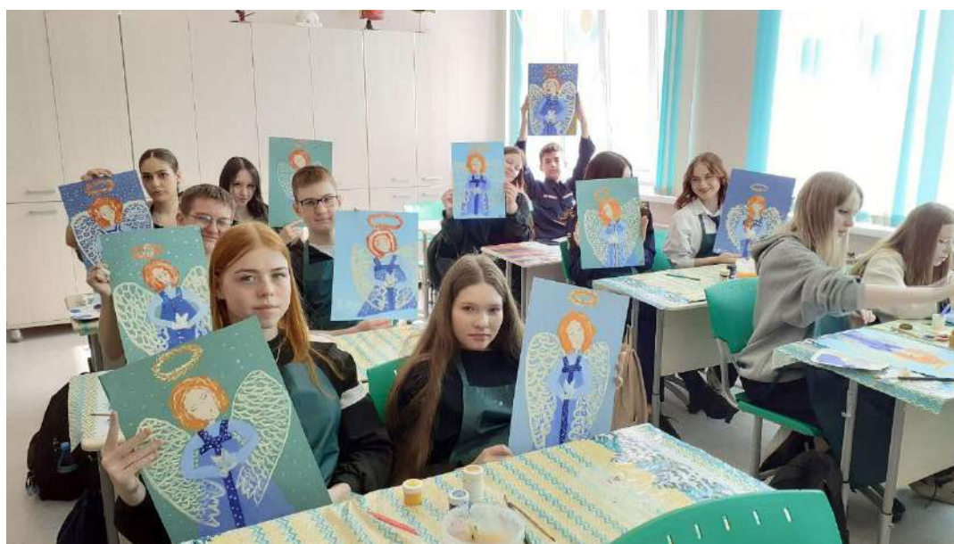
ЮМДИИ, мастер-класс «Ангел мира», май