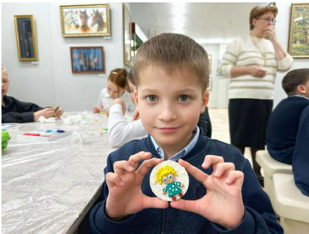
ЮМДИИ, культурно-познавательная программа «В гостях у сказки», январь