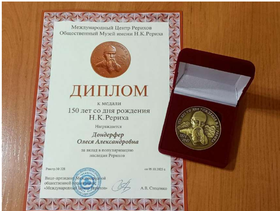
ЮМДИИ, юбилейная медаль «150 лет со дня рождения Н.К. Рериха» вручена Дондерфер О.А. 13 декабря