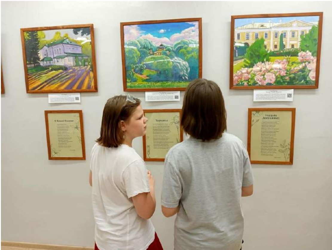
ЮМДИИ, посетители выставки «Магнит русских усадеб», июнь