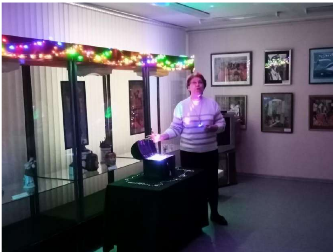
ЮМДИИ, культурно-познавательная программа «В гостях у сказки», январь