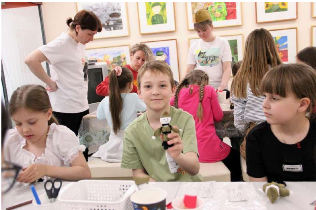
ЮМДИИ, «Ночь музеев», 17 мая