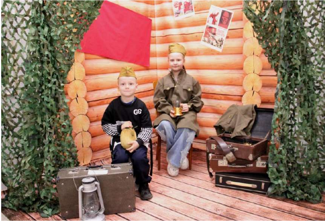
ЮМДИИ, «Ночь музеев», 17 мая