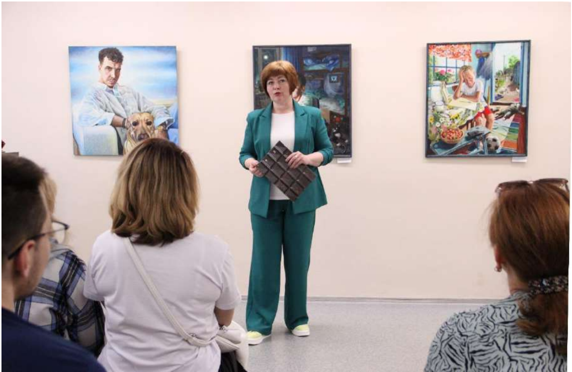
ЮМДИИ, открытие выставки «Кто это?», 30 мая