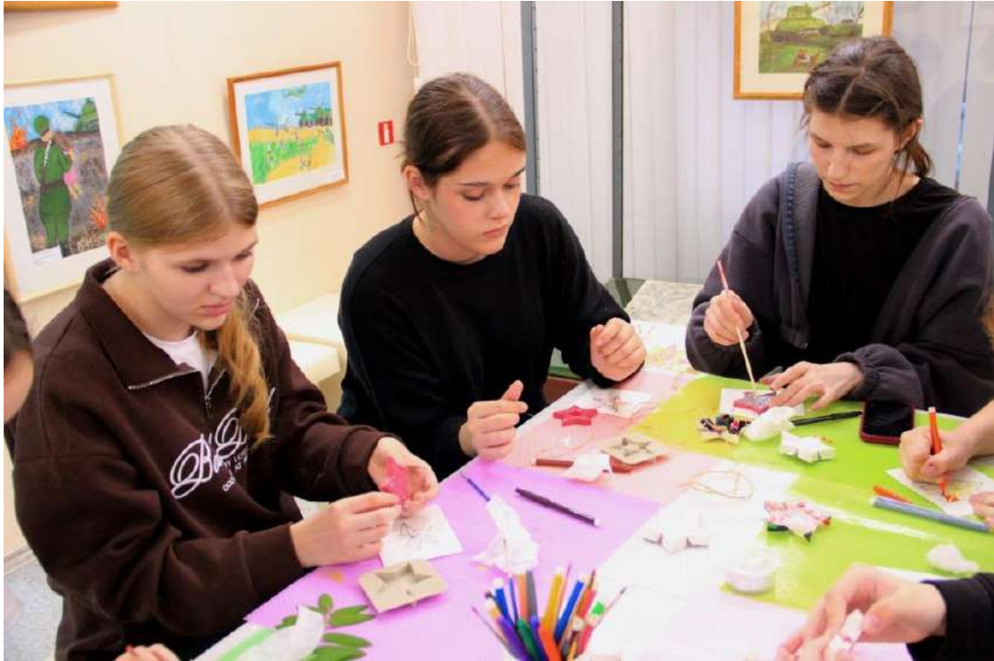
ЮМДИИ, «Ночь музеев», 17 мая