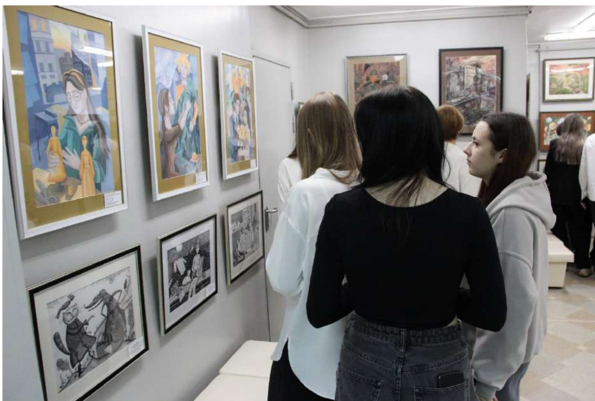
ЮМДИИ, посетители выставки «Мир, в котором я живу», январь