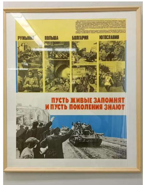
ЮМДИИ, выставка «Поклонимся великим тем годам», май