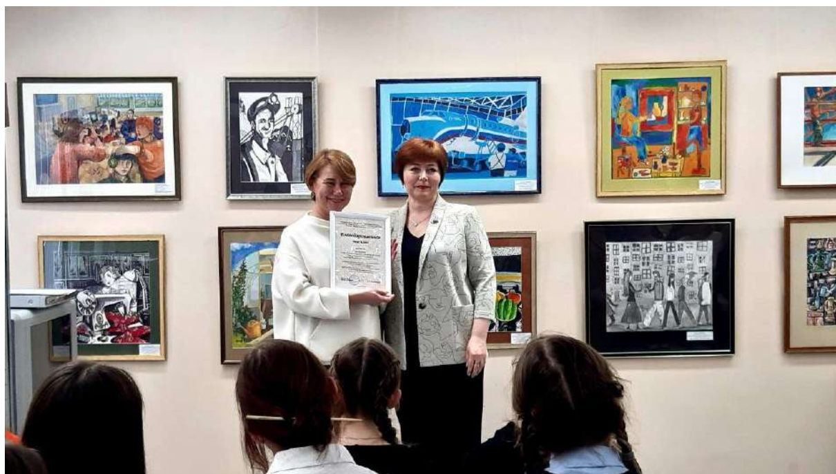
ЮМДИИ, открытие выставки «Мир, в котором я живу», январь