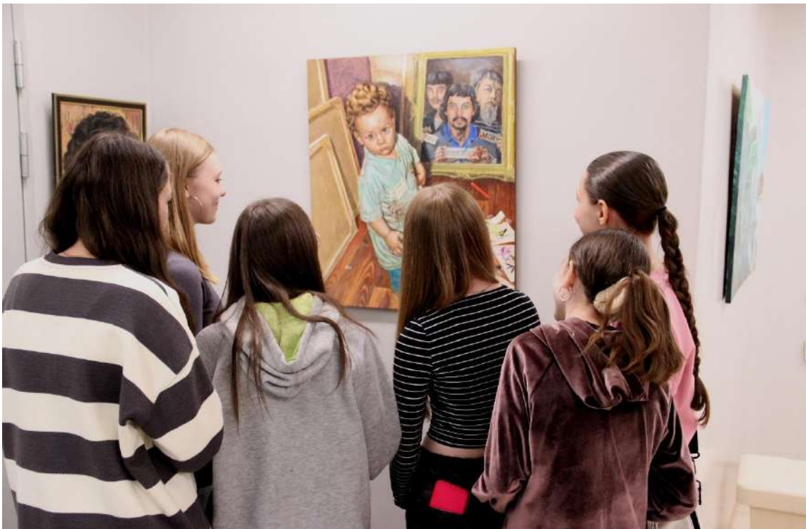
ЮМДИИ, посетители выставки «Кто это?», июнь