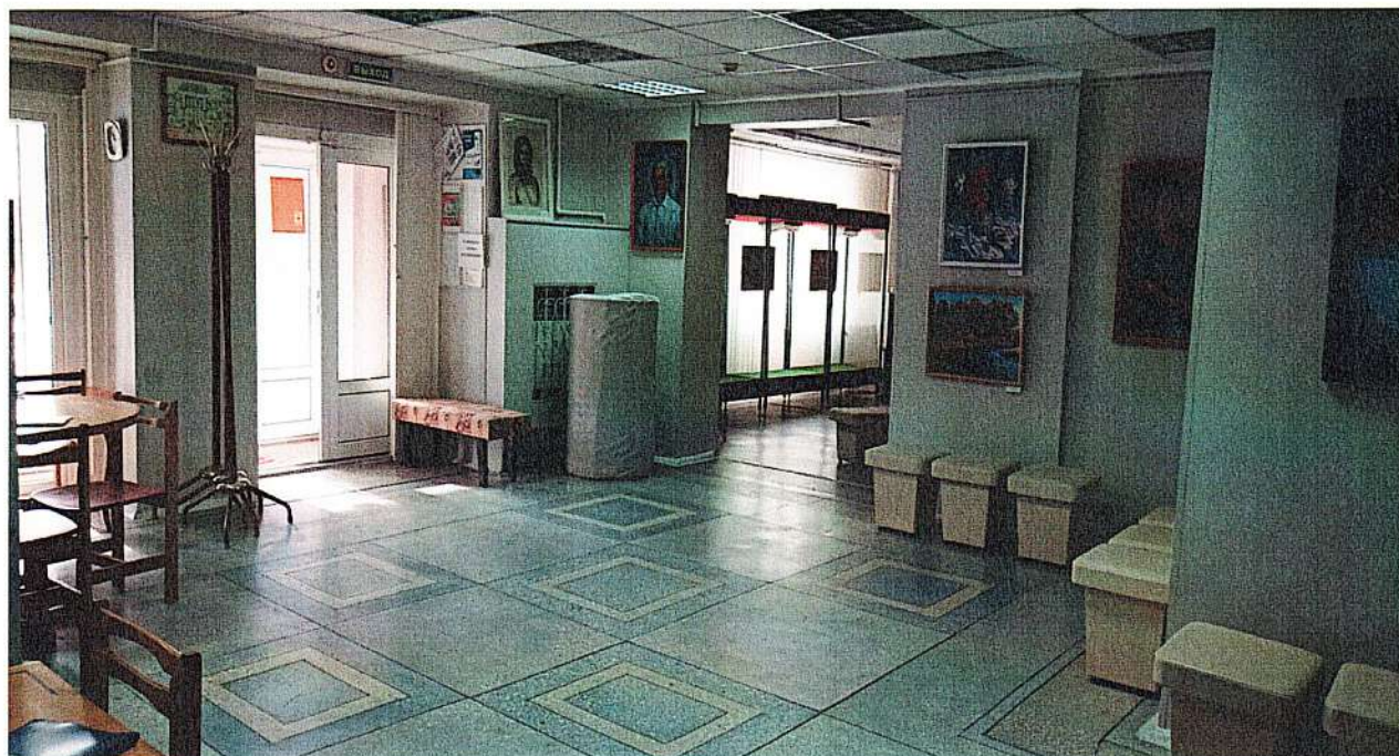
Отсутствует мнемосхема, что не соответствует требованиям п. 6.5.12 СП 59.13330.2020 Отсутствует контрастная маркировка открытого проема в стене, что не отвечает требованиям п. 6.4.1, п.6.2.23 СП 59.13330.2020