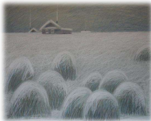
Красильников В.П., г. Новосибирск «Белоснежный пейзаж», 2007 Бумага, пастель 650 х 500 мм