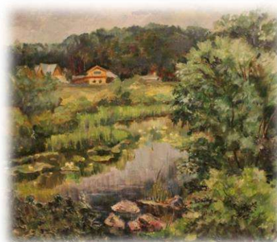
Лобанова Л.В. г. Юрга, «Курортная зона Лебяжки», 2005 ДВП, масло 50,0 x 58,0 см