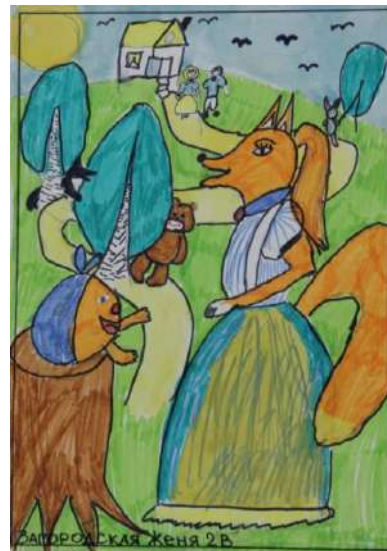
Загородская Евгения, 9 лет, г.Юрга «Иллюстрация к сказке «Колобок»