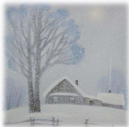
Красильников В.П., г. Новосибирск «Белоснежный пейзаж», 2011 Холст, масло 64,0 х 64,0 см

В 2019 году предметы прошли оцифровку, атрибуцию и были внесены в Книгу поступлений основного фонда.