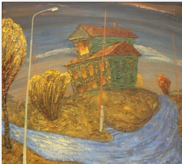
В. Толпыга, «Томск одинокий». Холст, масло. 61,0x68,0см