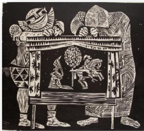
А. Дацюк, «Куклы». Бумага, ксилография. 350х400 мм