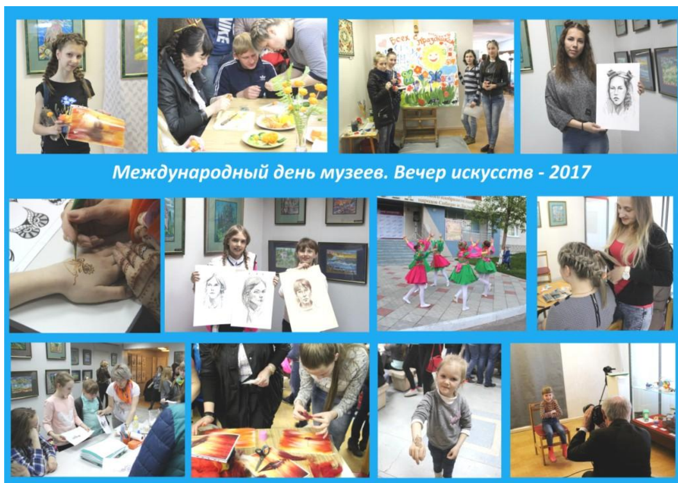
Международный день музеев. Вечер искусств - 2017

посетителей с популярными техниками декоративно-прикладного искусства: живопись войлоком, карвинг (фигурная нарезка овощей и фруктов), мехенди (один из современных стилей боди-арта).