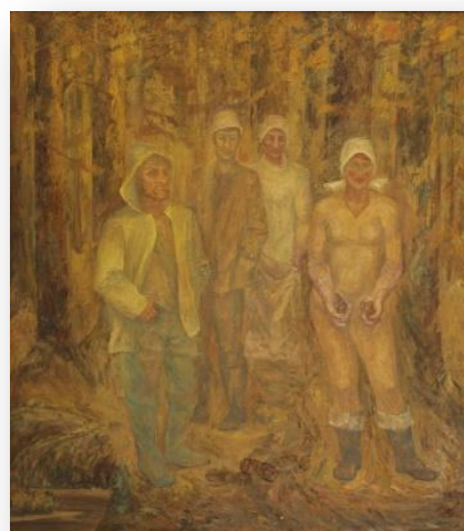
В. Толпыга, «Шория. Сборщики орехов». Холст, масло. 122,0x110,0 см